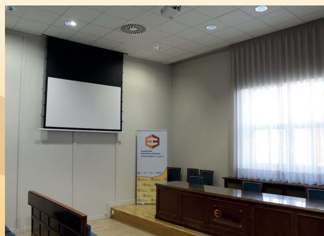
Imágenes tomadas del remodelado Salón de Grados.