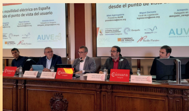
Ciclo Movilidad Urbana IEDIS-Cámara Zaragoza