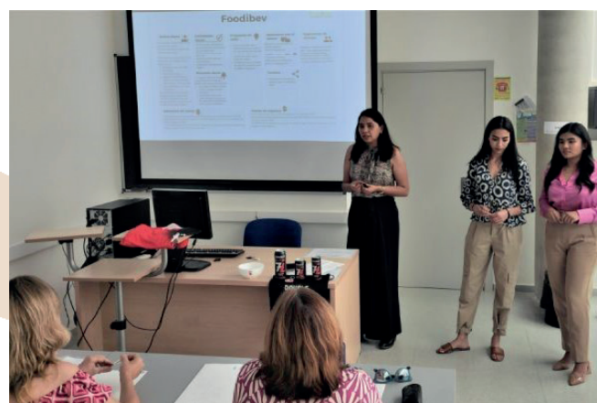
Exposición de Proyectos TFM.