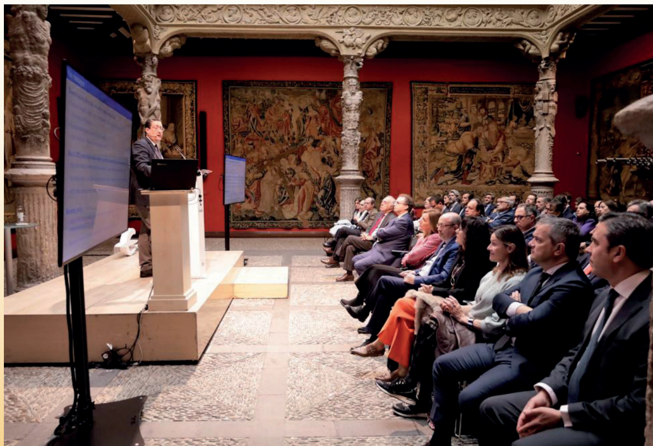
Imagen tomada durante la sesión impartida por Óscar Arce.

Cristina Herrero, Presidenta de la Autoridad Independiente de Responsabilidad Fiscal (AIREF), repasó la evolución de la coordinación de políticas en materia fiscal en la Unión Europea. Si bien la crisis COVID-19 trajo consigo la necesaria adaptación de las reglas fiscales de los Estados miembros de la Unión Europea al nuevo entorno, superada la fase más aguda de la crisis se han retomado las actuaciones orientadas a la conformación de un marco fiscal unitario. Cristina Herrero puso en valor la participación de la AIREF en las propuestas de reforma del marco fiscal europeo. La ponente fue presentada por Jesús Sierra, Secretario General de Ibercaja. El ciclo de conferencias fue clausurado por José Mariano Moneva, Decano de la Facultad de Economía y Empresa.