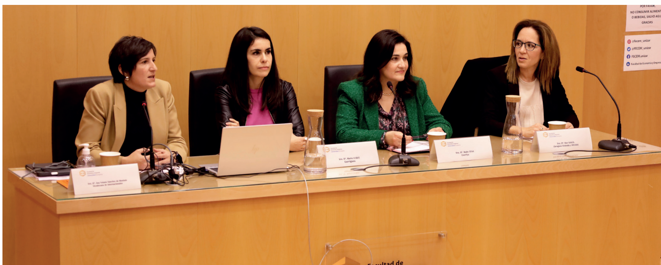
Imagen tomada durante la Mesa Redonda: “Las claves de la internacionalización profesional”.

Las directivas finalizaron su intervención poniendo de relieve algunos consejos para los estudiantes de la Facultad que estén pensando en dar una proyección internacional a sus carreras. Entre otros aspectos, las ponentes hicieron hincapié en la importancia de los idiomas, las habilidades para relacionarse y trabajar en equipos multiculturales y la relevancia de salir a otras universidades, aconsejando a los alumnos aprovechar las oportunidades que ofrecen los programas universitarios de movilidad internacional, como Erasmus u otros programas internacionales.