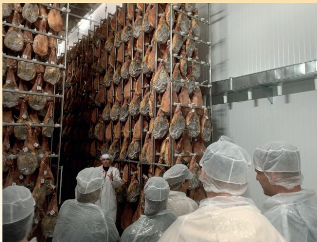
Imagen tomada durante la visita realizada a Jamones Eutiquio.

Desde aquí agradecemos a la empresa su amabilidad y disposición para la realización de la visita.