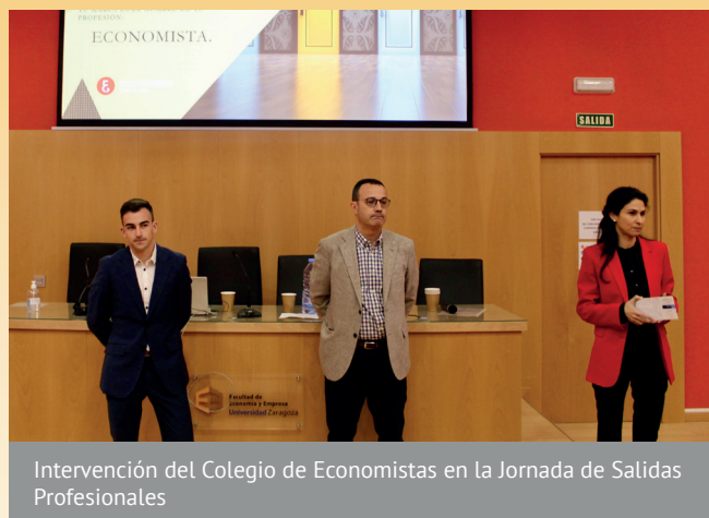
Intervención del Colegio de Economistas en la Jornada de Salidas Profesionales

A través de estas intervenciones, se pretendía presentar a los estudiantes los diferentes caminos laborales que podrán tomar cuando terminen sus estudios de grado. Para ello, se abordaron las diferentes áreas de conocimiento que abarca nuestra Facultad, se presentaron trabajos vinculados tanto al ámbito público como al privado, y se trató de recoger el testimonio de los principales empleadores de Aragón. En todos los casos, las empresas presentaron sus programas de becas para la realización de prácticas en empresa, dirigidas a formar perfiles profesionales asociados a nuestras titulaciones.