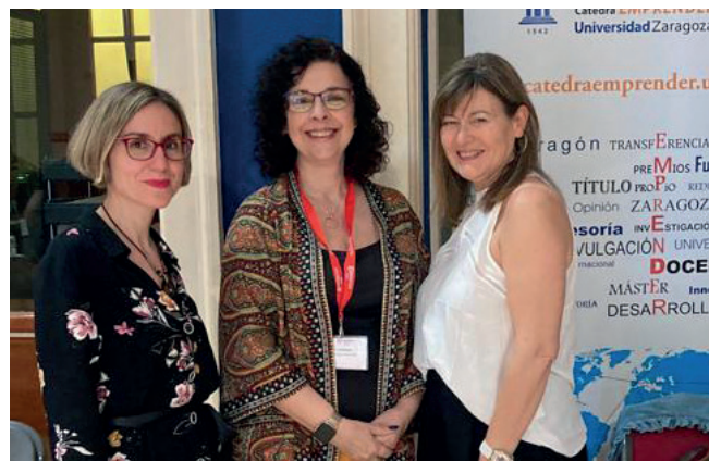
Participación de la Cátedra Emprender en la VII Feria de Empleo y Emprendimiento de Cámara Zaragoza.