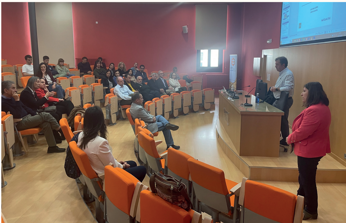
Imagen tomada durante una de las sesiones de los BBS.

https://brownbagseminarsbbs.wordpress.com