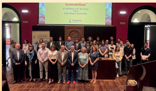
Imagen tomada durante el II Congreso IEDIS