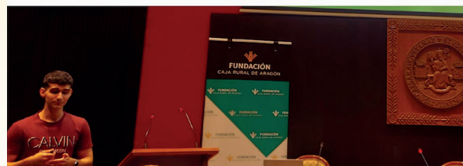
En la imagen el estudiante premiado Alberto Labuena durante la presentación de su TFM premiado.