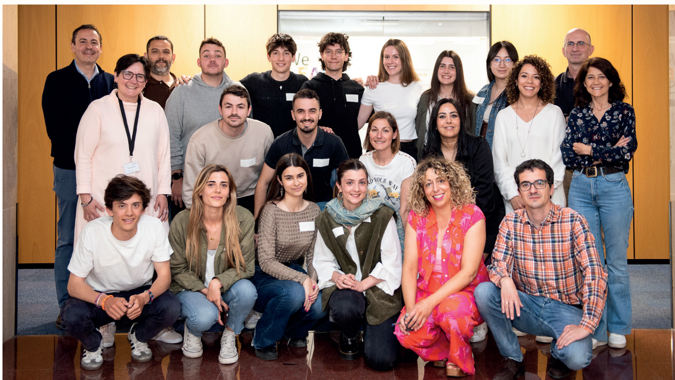
Imagen tomada durante una sesión de la Empresa Innovadora.

Otras actividades: Igual que en cursos anteriores, BSH Electrodomésticos España, a través de la Cátedra, participa en la dirección de TFG y TFM en temas relacionados con la innovación. Asimismo, mantiene un programa de becas para la realización de proyectos y prácticas formativas. Además, profesionales de BSH han impartido distintos seminarios en diversas Facultades de la Universidad de Zaragoza.