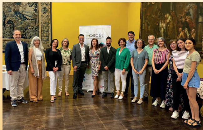
Asistentes al Encuentro “Economía Social, aliada para un desarrollo sostenible”.

En Aragón, la Economía Social, representada por CEPES como entidad que aglutina a las entidades de los diferentes sectores, cuenta con su reciente Ley de Economía Social aragonesa, acompañada de un primer Plan de Impulso de la Economía Social que extiende sus actuaciones hasta 2025. Otras comunidades autónomas, diferentes países y varios organismos internacionales continúan legislando, impulsando y defendiendo la Economía Social como herramienta fundamental para luchar contra el cambio climático, mitigar las crisis ecosociales y facilitar una vida mejor a escala local y planetaria.