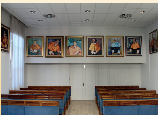
Imágenes tomadas del remodelado Salón de Grados.

ello, además de trasladar las conexiones eléctricas e informáticas a la parte central de la tarima, se ha instalado un cañón HDMI en el techo junto con una pantalla para proyectar escamoteable automática. Además, se ha instalado tarima flotante en el suelo, sustituido el entelado de las paredes y cambiado cortinas y tapicerías optando por grises y azules de la gama del logo de la universidad.