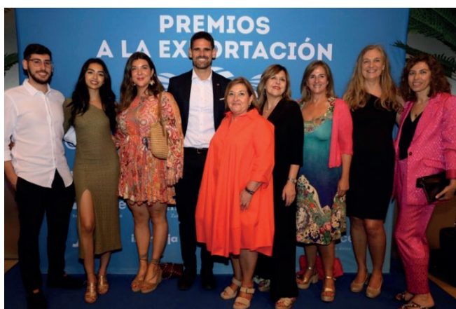
Gala de los Premios de la Exportación.

También en el mes de junio los alumnos han realizado las defensas de sus correspondientes TFM ligados todos ellos a proyectos reales de exportación. Las exposiciones se han realizado ante tribunales de expertos en internacionalización de Cámara de Comercio y Aragón Exterior. Este trabajo les permite poner en valor todos los conocimientos adquiridos en sus prácticas remuneradas en las empresas, y de los diferentes módulos del Máster. Este es el punto final, tras el cual los alumnos están ya perfectamente preparados para incorporarse al mundo profesional del Comercio Exterior.