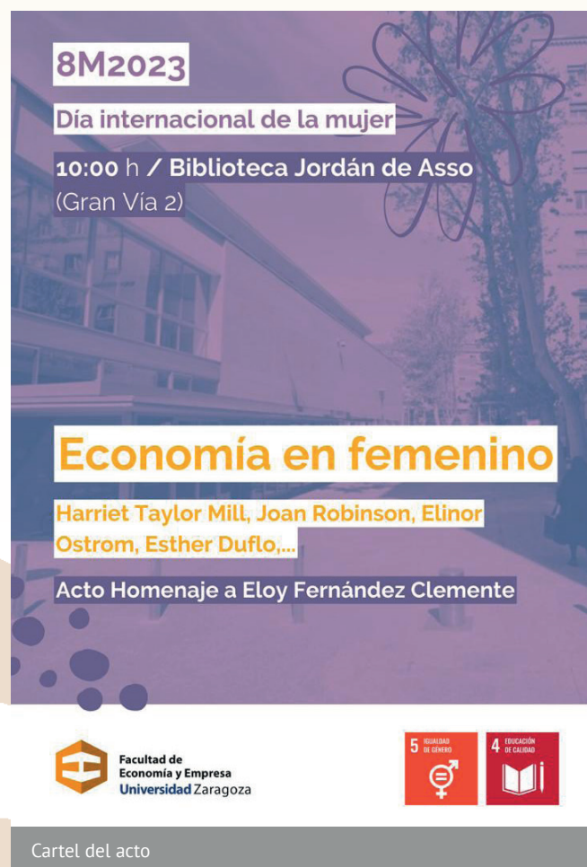
Cartel del acto