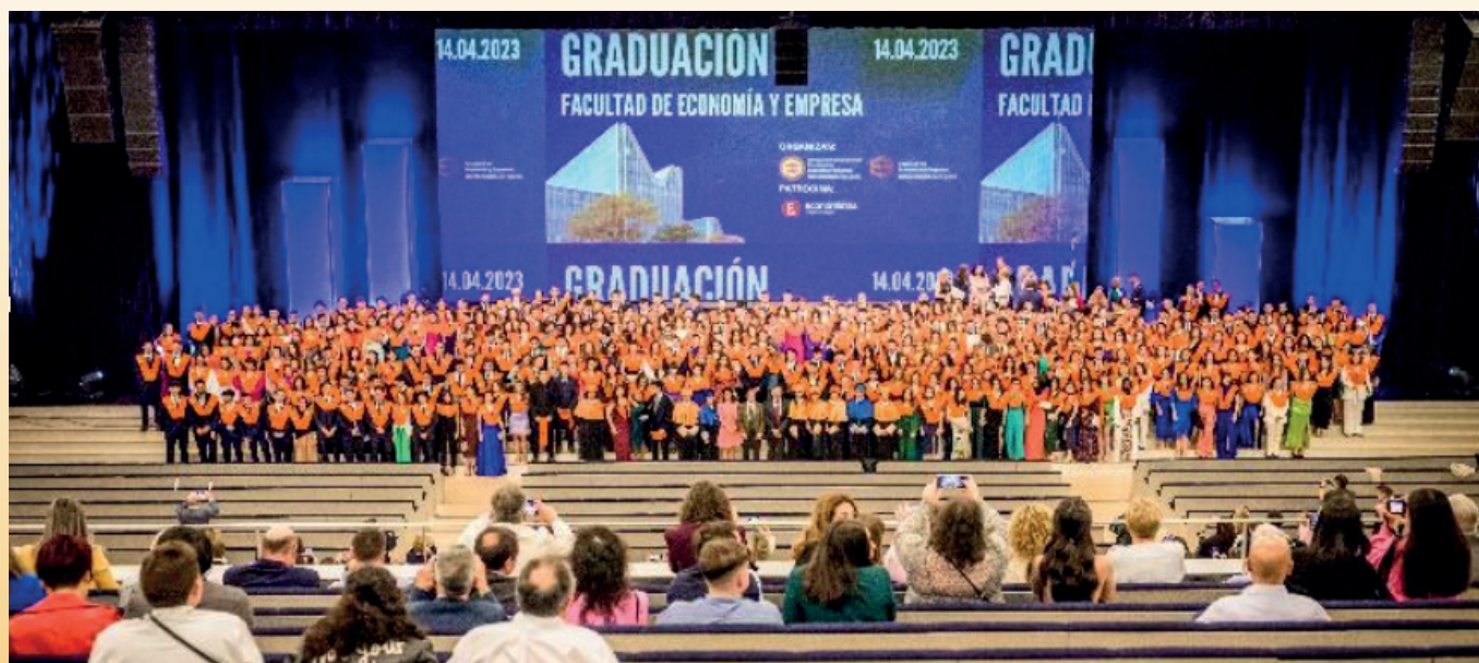
Foto grupal de los estudiantes graduados de la promoción 2019 – 2023.