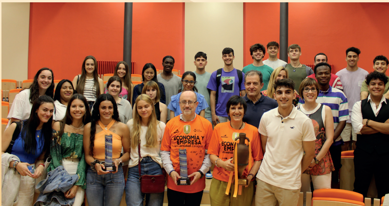
Imagen tomada durante el acto de reconocimiento a los equipos de deportes de la Facultad.