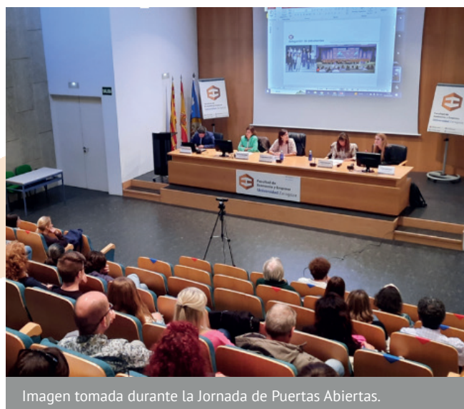
Imagen tomada durante la Jornada de Puertas Abiertas.