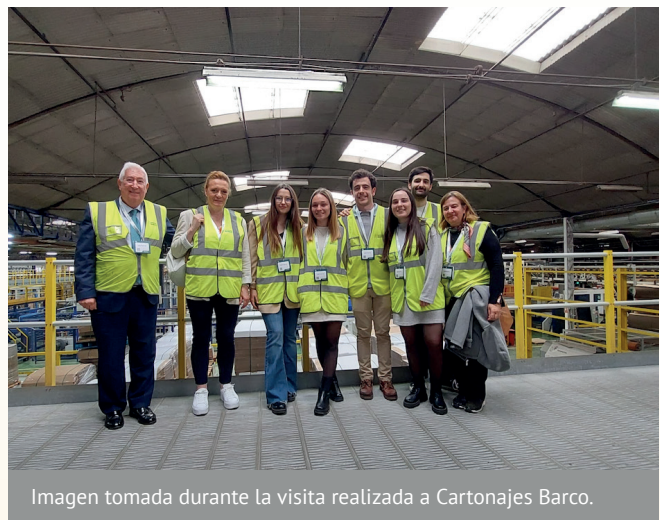
Imagen tomada durante la visita realizada a Cartonajes Barco.

De esta forma, estudiantes y profesores han podido conocer las mejores técnicas, la flexibilidad, la innovación y la calidad de los diferentes productos que la empresa produce y comercializa. Además, han conocido las inversiones en infraestructura industrial de última tecnología para ofrecer soluciones de embalaje, utilizando como palanca de impulso la digitalización y la innovación. Esta actividad, que se contempla en la guía académica de la asignatura, ofrece a los estudiantes una visión práctica del contenido de la asignatura.