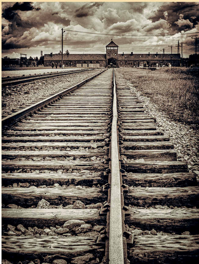
“Auschwitz”. Fotografía ganadora del concurso de Fotografía “Trotamundos” de la Facultad de Economía y Empresa en su edición de 2023.