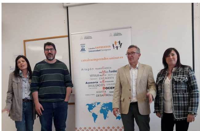
Clausura de la Actividad Complementaria Formativa "Ciclo de Píldoras Formativas en Emprendimiento".

Finalmente, en el capítulo de Divulgación , la Cátedra Emprender ha participado en el proyecto "Diseño del Mapa del Emprendimiento en Aragón" promovido desde el INAEM en desarrollo de la Ley 7/2019 de 29 de marzo de apoyo y fomento del emprendimiento y del trabajo autónomo de Aragón. Asimismo, la Cátedra participó el pasado 13 de marzo en la jornada Dayone Innovation Summit Aragón (Day One Premios Emprende XXI de la Caixa). Finalmente, está confirmada una próxima presentación divulgativa de la Cátedra Emprender por parte del director de la Cátedra en la Escuela de Ingeniería y Arquitectura UNIZAR gestionada a través de su Consejo de Estudiantes CEEINA.