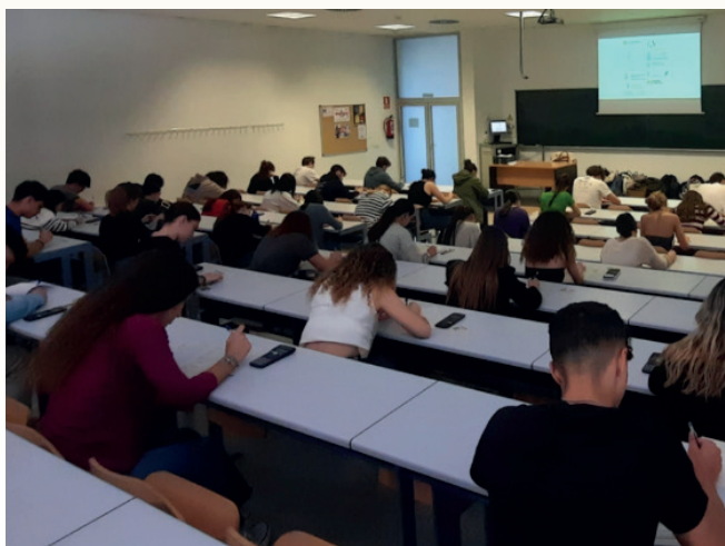
Imagen tomada durante la Olimpiada de Economía.

La XIV Olimpiada Española de Economía , organizada por la Facultad de Ciencias Económicas y Empresariales de la Universidad de Sevilla se celebró del 19 al 21 de junio de 2023.