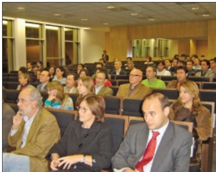
Aspecto de la sala en la inauguración de la IV edición del Máster en Administración Electrónica de Empresas (MeBA).

El objetivo del MeBA es formar a profesionales para su trabajo en empresas cada vez más digitales, por lo que sus conocimientos deben incluir el dominio de las tecnologías de la información y comunicación, su impacto en las funciones empresariales y el marco jurídico del comercio electrónico. Por otra parte, el enfoque multidisciplinar del MeBA lo hace apto para estudiantes con diferentes perfiles y provenientes tanto de campos sociales (ciencias económicas o empresariales, derecho, etc.) como técnicos (ingenieros medios y superiores) y, en general, por cualquier persona interesada en la gestión y dirección de empresas utilizando las nuevas tecnologías.