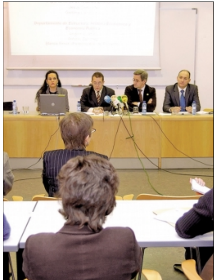
Momento de la presentación del Proyecto Migración en Aragón dentro de las actividades de la Cátedra Multicaja.

Esta parte del trabajo se centra en analizar los efectos económicos de la inmigración en el crecimiento económico arago-