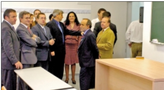
Visita a las nuevas instalaciones de la Facultad.