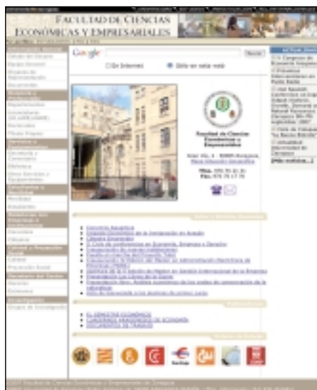
Portal de la nueva página web de la Facultad.