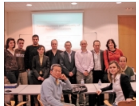
Participantes en el grupo II Workshop on Economics of the Family .