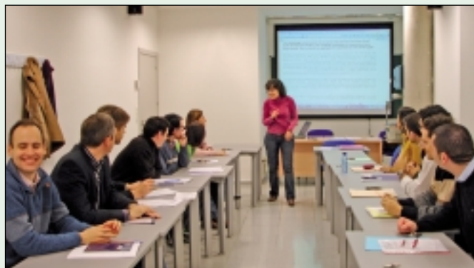
Un momento de las clases de Inglés para profesores de la Facultad.

El curso suscitó el interés de gran parte del personal docente e investigador de la Facultad de Ciencias Económicas y Empresariales. Por ello, y por tratarse de una experiencia piloto, muchos interesados no pudieron sumarse al curso. Si, como parece, resulta satisfactorio para quienes ahora lo están recibiendo, se espera poder realizar nuevos cursos que satisfagan las necesidades de comunicación en lengua inglesa del personal docente e investigador de esta Facultad en años sucesivos.