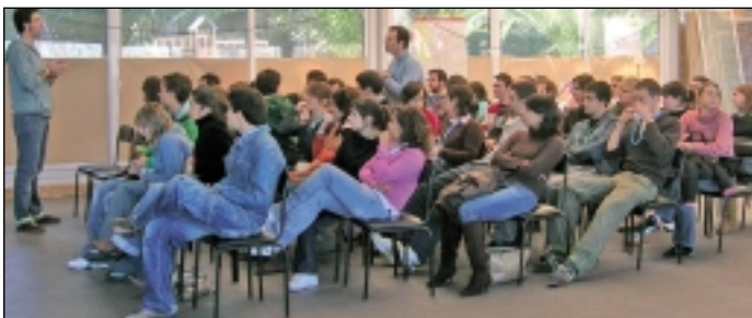
Congreso Regional en San Sebastián. JPA (Jornadas de Presentación de AIESEC) para nuevos miembros.

En el mes de octubre tuvieron lugar sesiones informativas sobre la actividad de AIESEC en términos generales y del programa de prácticas remuneradas. Las presentaciones se realizaron en las ocho facultades donde actualmente nos encontramos: Ciencias Económicas y Empresariales, CPS, E.U. de Estudios, EUITZ, Empresariales, Filosofía y Letras, Derecho, Estudios Sociales y Enfermería. La sede de AIESEC se sitúa en la Facultad de Ciencias Económicas y Empresariales de Zaragoza.