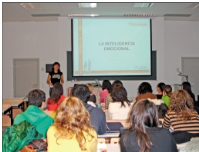
Momento de uno de los seminarios organizados por UNIVERSA.