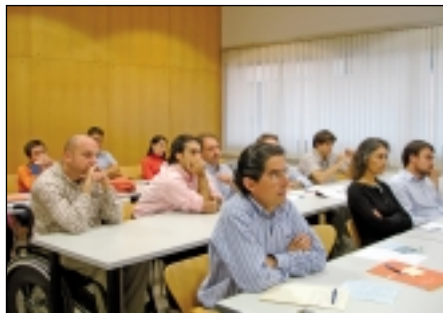
Asistentes a las Jornadas de Economía Pública.

Celebración de las IV Jornadas de Economía Pública, que organiza el Grupo de Investigación Consolidado en Economía Pública. Este año el tema de las Jornadas ha llevado por título "Problemas Actuales de Federalismo Fiscal". Dichas jornadas se comentan más adelante.