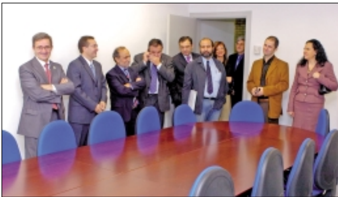
Visita a las nuevas instalaciones de la Facultad.

Respecto al servicio de informática cabe señalar que, como consecuencia de la elaboración de la RPT del personal de administración y servicios a la Facultad, le fue asignada una nueva plaza de operador informático, que ha sido cubierta desde el 1 de diciembre.