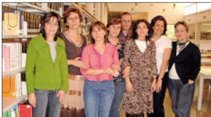
Personal de la Biblioteca de la Facultad encargado de realizar sesiones formativas dirigidas a los alumnos de primer curso sobre el funcionamiento de la biblioteca y sus servicios.

Las respuestas ante esta iniciativa han sido, en general, muy positivas y un gran número de alumnos ha considerado muy interesante la información suministrada. La biblioteca, por su parte, ha tenido en cuenta las sugerencias allí recogidas y desde comienzos de