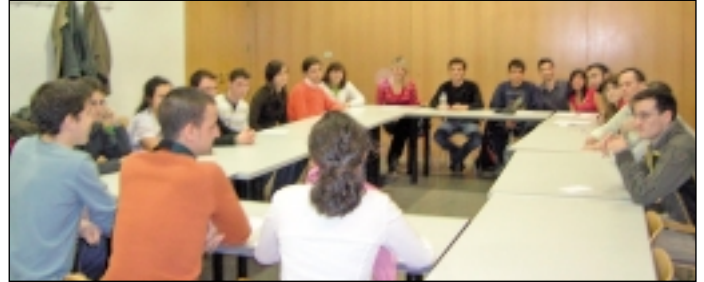
Asamblea de Navidad de la AIESEC Zaragoza.