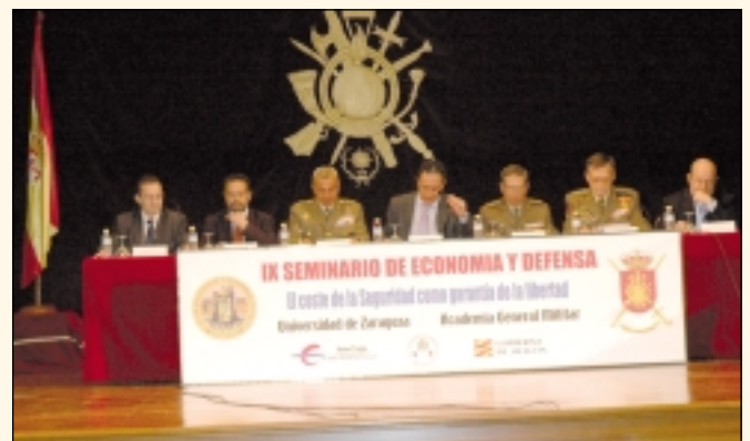
Un momento de la clausura del IX Seminario de Economía y Defensa.

En este sentido, la Facultad de Ciencias Económicas y Empresariales y la Academia General Militar deben continuar con el camino que emprendieron hace nueve ediciones. Nuestra obligación es facilitar un marco de estudio capaz de vincular a la sociedad para hacerla partícipe de la estrecha vinculación que existe entre la economía y la defensa del mismo modo que sucede en países como Estados Unidos y el Reino Unido. La evolución constante que están sufriendo las estructuras defensivas requieren del análisis económico para revelar la importancia de distintos parámetros económicos a la hora de decidir acerca de la defensa óptima que desean los Estados, de forma que los especialistas necesitan del apoyo de las instituciones capaces de ofrecer foros de debate como el propuesto por el Seminario de Economía y Defensa.