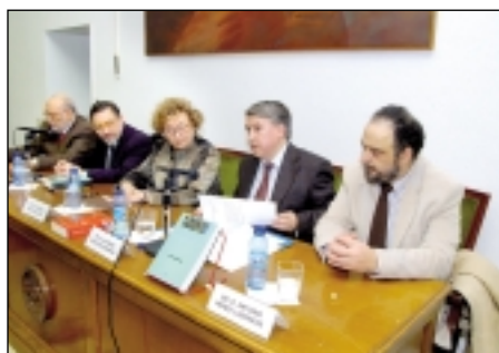
Presentación de la obra de Alessandro Roncaglia, La riqueza de las ideas .

La riqueza de las ideas , en su versión original italiana, obtuvo en 2003 el premio Adolphe Blanqui a la mejor obra europea sobre Historia del pensamiento económico que otorga la European Society for the History of Economic Thought. La obra, posteriormente publicada en inglés por Cambridge University Press, acaba de ser traducida al castellano y editada por Prensas Universitarias de Zaragoza, con la colaboración de la Fundación Ernest Lluch. Su autor, el prestigioso economista italiano Alessandro Roncaglia, discípulo del recientemente fallecido profesor Paolo Sylos Labini, ha destacado por sus trabajos sobre Historia del pensamiento económico, siendo ya considerados como clásicos los realizados sobre W. Petty o P. Sraffa, así como los relacionados con el mundo de la economía aplicada, los dedicados a cuestiones energéticas (la economía del petróleo), o sobre el mercado y el papel de las instituciones públicas.