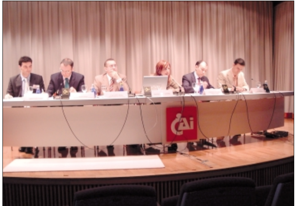
Acto de presentación de las V Jornadas InfoDIEZ

Sin duda alguna, estos dos años de trabajo han supuesto para el equipo gestor un reto personal y profesional para sus miembros, puesto que se ha hecho frente a importantes decisiones estratégicas y operativas; desde realizar un programa bianual de actividades, hasta mejorar los procesos de trabajo interno. Fruto de ello se ha conseguido ampliar el campo divulgativo objeto de nuestra Asociación, a través de nuevos