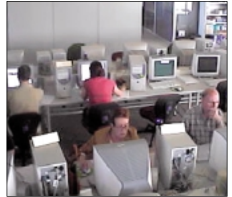
Una sesión de trabajo con consumidores, que realizan una compra en una tienda virtual.

liza la usabilidad siguiendo técnicas heurísticas, etc. Todo ello destinado a detectar posibles fallos en el diseño y en el contenido que impiden que el usuario/consumidor navegue con comodidad y manteniendo el control. Por tanto se busca mejorar una aplicación para que sea fácil de usar y que se aprenda a utilizar rápidamente. No debemos olvidar que desarrollar un sitio web conlleva una serie de gastos, y si la información que allí se muestra es inaccesible o los usuarios no saben como utilizarla es como si no existiera, y por tanto las empresas están perdiendo dinero. Final-