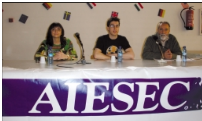
Jornada Internacional organizada por el colectivo AIESEC.