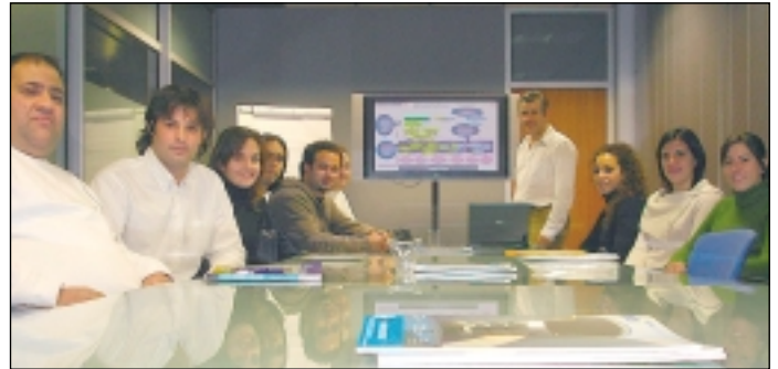
Grupo de estudiantes en el Máster en Administración Electrónica de Empresas.

El MeBA tiene plena justificación ya que cada vez son más numerosas las empresas que realizan funciones empresariales u operaciones comerciales utilizando tecnologías de la in-