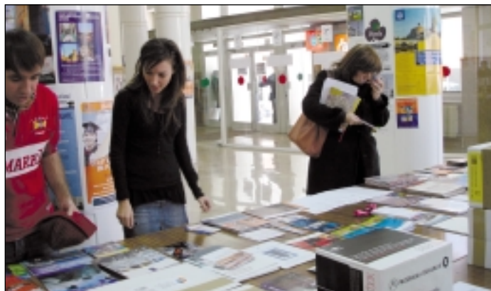
Un momento de la Feria de Movilidad en el hall de la Facultad.

Por último, también cabe destacar la celebración del Patrón de la Facultad el 30 de Marzo (más adelante se detallan los actos preparados) y la presentación de la Facultad en Institutos de Enseñanza Secundaria.