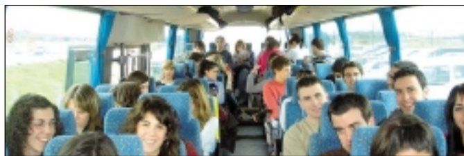
Estudiantes de la Facultad se dirigen en autobús al Parque Tecnológico Walqa.