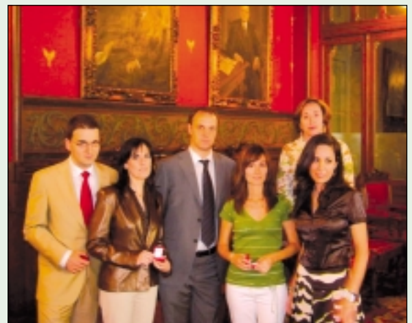
Cinco jóvenes economistas licenciados en la Facultad de Ciencias Económicas y Empresariales de Zaragoza recibieron la insignia de plata del C.E.A como reconocimiento por ganar el juego de simulación de cartera de valores organizado por el Instituto B.M.E.

Para poder actuar en el Mercado Español de Futuros Financieros, Meff, tanto los operadores como el personal de Compensación y Liquidación debe estar en posesión de dos licencias que acreditan unos conocimientos mínimos tanto del funcionamiento del mercado como de los productos financieros que en este mercado se negocian. Un año más, los dieciséis alumnos de Zaragoza formados en el C.E.A han conseguido las licencias de meff tras la realización del examen oficial. Este año, el 31% de los alumnos obtuvo un 100% de aciertos en las dos licencias y la media de las preguntas bien contestadas en la licencia I fue de 97,5% y en la licencia II del 95,4%.