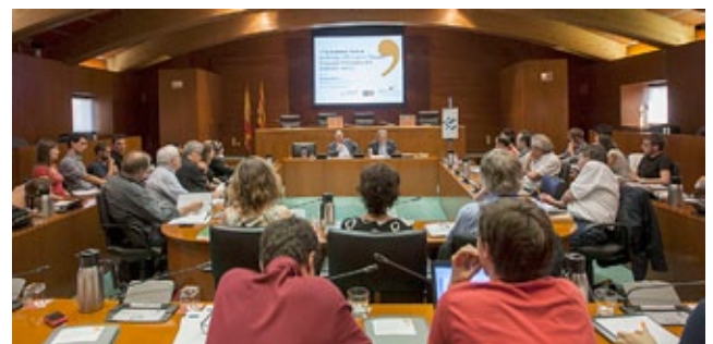
Sesión de trabajo en el 17th Summer School on History of Economic Thought, Economic Philosophy and Economic History.

Las sesiones de trabajo se celebraron en la Sala de Junta de Gobierno del edificio Paraninfo de la Universidad de Zaragoza durante los días 1 a 7 de septiembre de 2014, alojándose tanto los alumnos como los profesores, en el Colegio Mayor Cerbuna: Todas las dependencias necesarias para la celebración del certamen fueron puestas a disposición de los participantes por el Rectorado de la Universidad de Zaragoza. El equipo de dirección de la Summer School y de la Universidad de la Sorbona felicitaron efusivamente a la organización y agradecieron a la Universidad de Zaragoza todo el apoyo que permitió la celebración de la Escuela. La decimo-octava edición de la Summer School se celebrará en Stuttgart en septiembre de 2015.