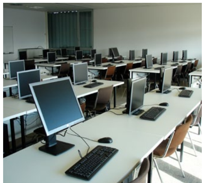
Nueva Aula de Informática de la Facultad de Economía y Empresa (Campus Río Ebro).

Como en el año anterior solo me queda desear que en el 2015 podamos seguir mejorando en docencia para mantenernos como referente para los estudiantes actuales y futuros.