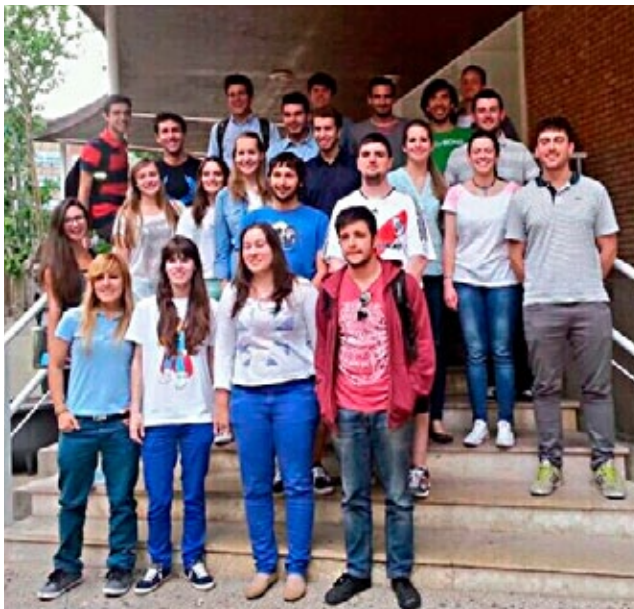
Miembros del Equipo de Delegación de Estudiantes de la Facultad de Economía y Empresa.

Por último, hemos comenzado a desarrollar el ciclo de actividades culturales para los meses de febrero, marzo y abril, que abarcarán actividades ya conocidas como el Ciclo de Cine Económico, o un Debate Electoral con motivo de las elecciones municipales y autonómicas, u otras novedosas como un variado y completo Ciclo de Conferencias sobre temas relacionados con la Economía y la Empresa que pondremos en marcha con motivo de la celebración del Patrón de la Facultad. En definitiva, seguiremos volcados en nuestra labor, representar un auténtico servicio público para la comunidad universitaria de la Facultad.