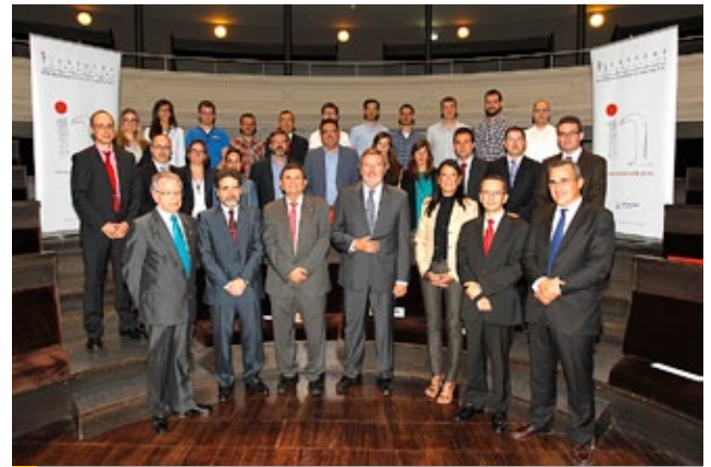
Premiados en la VIII edición de Premios BSH-UZ a la Innovación en la empresa

Por noveno año consecutivo, la Cátedra BSH Electrodomésticos en Innovación y la Universidad de Zaragoza convocan el Premio a BSH-UZ a la Innovación en la empresa, unos premios con los que ambas instituciones reconocen las propuestas de innovación empresarial presentadas por estudiantes e investigadores.