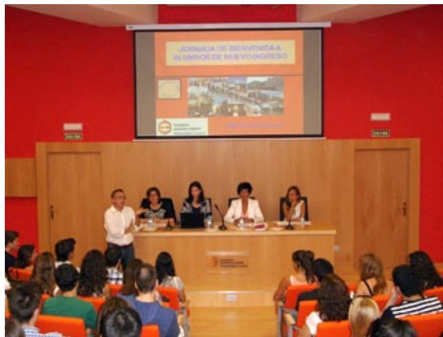
Jornada de Bienvenida a los nuevos alumnos de la Facultad de Economía y Empresa (Campus Paraíso).

El resultado alcanzado ha sido muy satisfactorio, alcanzando una asistencia que superó los 400 estudiantes. Además, se observó en el alumnado un gran interés por la titulación que comenzaban a cursar así como un claro espíritu participativo, muy importante para afrontar con éxito sus estudios universitarios. Finalmente, desde el Decanato de la Facultad, queremos agradecer a todos los participantes en estas jornadas así como al personal de administración y servicios, por su amable disposición y ayuda, las cuales facilitaron enormemente el desarrollo de esta actividad.