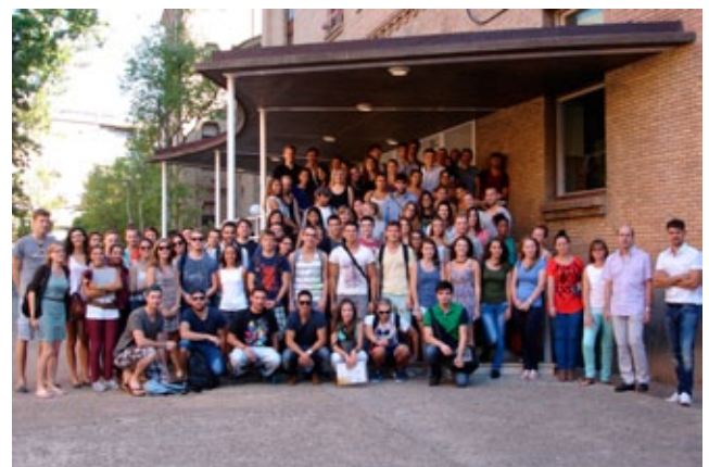
Jornada de Bienvenida a los estudiantes Erasmus