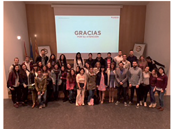
Sesión del V Ciclo de Experiencias Marketing y Sociedad.

V Ciclo de Experiencias Marketing y Sociedad (por Carmen Berné). Los ciclos de Marketing y Sociedad iniciados el curso 2012-1013, han cubierto ya su quinta andadura este curso 2016-2017. Sirviendo como conexión entre la sociedad y el marketing, desde noviembre del año pasado hasta mayo del año presente, el V Ciclo de Experiencias que organiza el Departamento de Dirección de Marketing e Investigación de Mercados de la Universidad de Zaragoza, ha contado con las intervenciones de señalados profesionales de nuestro entorno más próximo. En esta edición se ha buscado cercanía con la intención de destacar la sobresaliente actividad económica que se realiza en nuestra Comunidad. La coordinación del ciclo se ha esforzado este curso por adaptar las temáticas a contenidos relativos a las asignaturas del Grado de Marketing e Investigación de Mercados, así como en procurar un calendario adaptado a las necesidades del Grado. El resultado ha sido muy satisfactorio, con un número de asistentes creciente cada edición, quienes manifiestan su agradecimiento por la puesta en marcha de la actividad, destacando el valor de la interacción que el evento facilita entre expertos, experiencias e inquietudes de los asistentes. Los expertos que han colaborado en esta ocasión, todos ellos con relación directa con la toma de decisiones en el área del marketing,