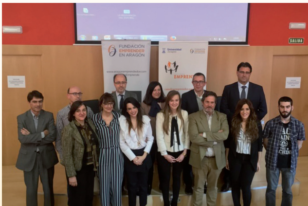
Profesores, estudiantes e invitados en el acto de entrega de Premios Trabajo Fin de Grado y Trabajo Fin de Máster en Emprendimiento.