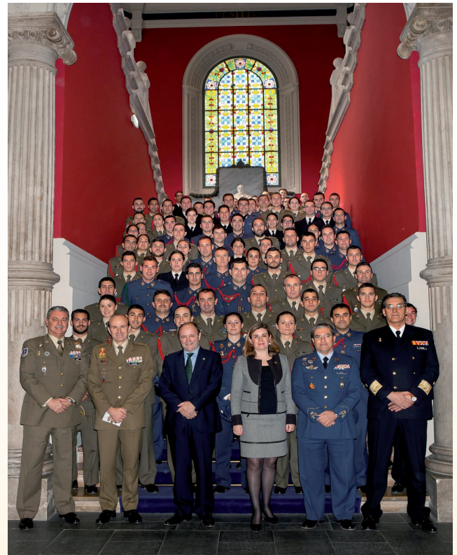
Foto de familia en el Paraninfo con los asistentes a las Jornadas de Economía y Defensa.

el próximo año celebraremos las vigésimas Jornadas de Economía y Defensa. Quedan todos invitados.