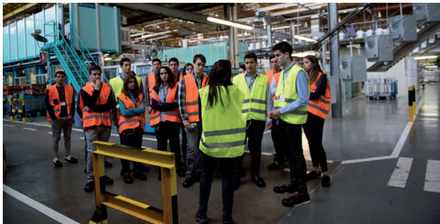
Alumnos de «La empresa innovadora» en una visita a la fábrica de BSH.

La AAC se impartió durante tres meses en la Facultad de Economía y Empresa y en las instalaciones de BSH España, incluyendo cuatro bloques temáticos sobre logística, marketing, controlling y recursos humanos. Además, los alumnos visitaron el Centro Logístico de BSH en Plaza, lo