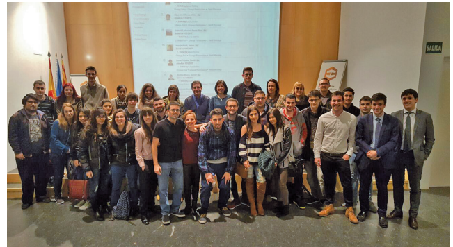
Foto de familia de la II Jornada de Egresados en las que se puede ver a algunos profesores de la Titulación junto con los ponentes de esa jornada y estudiantes actuales de dicho grado.

dad. Durante dicha jornada, antiguos egresados quisieron compartir con los actuales estudiantes de últimos cursos (3.º y 4.º) sus experiencias tanto a nivel de estudios de máster-postgrados realizados como tanto a nivel profesional. Algunos de los participantes en dicha jornada nos comentaron sus experiencias en grandes firmas de auditoría como PwC, en grandes firmas de seguros como Allianz, una experiencia como emprendedor, experiencias en departamentos de administración en pequeñas compañías, etc.