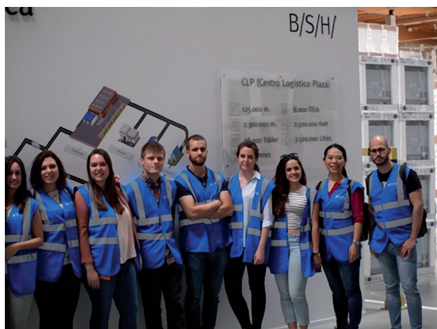
Alumnos del Máster, durante la visita al Centro Logístico de BSH en Plaza