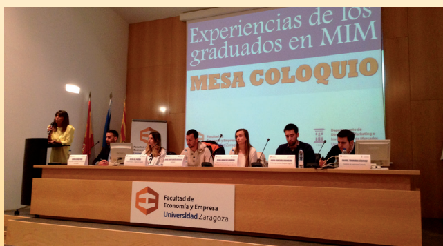
II Jornada sobre Experiencias Profesionales en el Grado en Marketing e Investigación de Mercados.