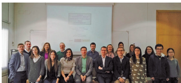
Participantes y asistentes al seminario «Social Influence, WOM and beyond: Future Trends in Digital Media».

El seminario contó también con la presentación de diversos trabajos de investigación sobre el tema.