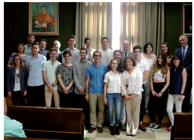
Entrega Premios Olimpiada. Entrega de Premios de la IX Olimpiada de Economía de la Comunidad Autónoma de Aragón

En relación al apartado de Estudiantes , el pasado jueves 20 de abril tuvo lugar la IX Edición de la Olimpiada