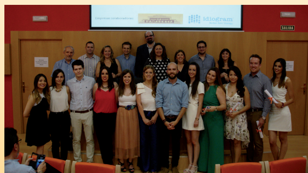
Foto de familia con profesores y estudiantes del Máster Universitario en Dirección, Estrategia y Marketing.