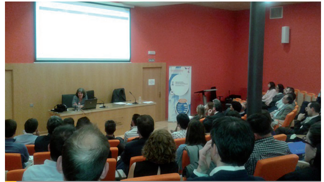
Conferencia de los Diplomas de Especialización y Extensión Universitaria en Asesoría Financiera y Operador de Mercados.

Adicionalmente, los alumnos pueden cursar 10 créditos optativos para obtener una formación técnica específica, necesaria y obligatoria para aquellos que estén interesados en conseguir las habilidades necesarias para operar en los Mercados Financieros, tanto en SIBE (Sistema de Interconexión Bursátil Español) como en MEFF (Mercado Español de Futuros Financieros).