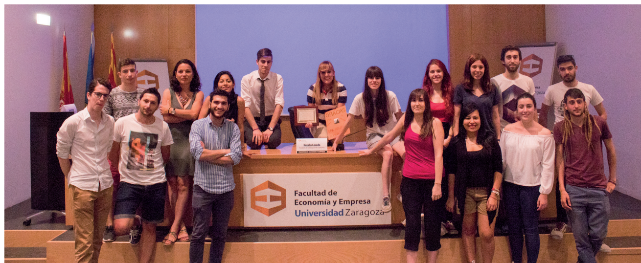
Miembros del actual Equipo Directivo de la Delegación de Estudiantes de la Facultad.