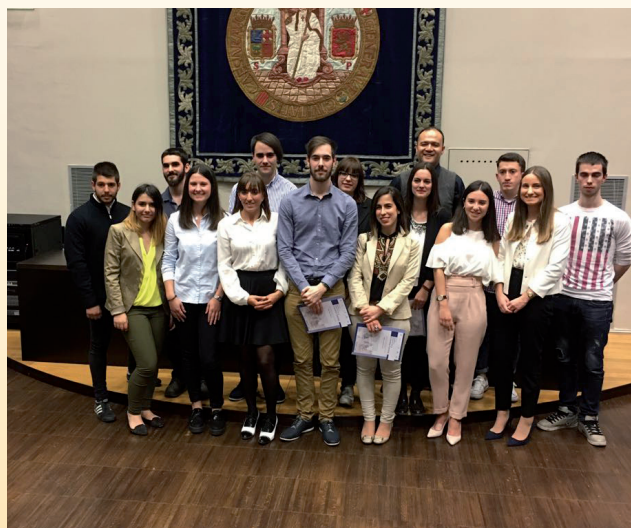
Estudiantes de la Cátedra Empresa Familiar en el acto de entrega de premios, curso 2016-2017.