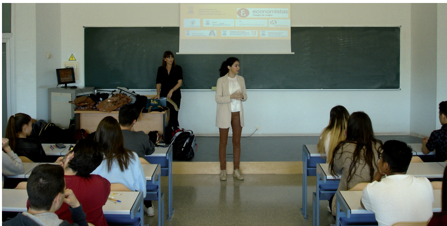
Examen Olimpiada. Realización del examen de la IX Olimpiada de Economía de la Comunidad Autónoma de Aragón