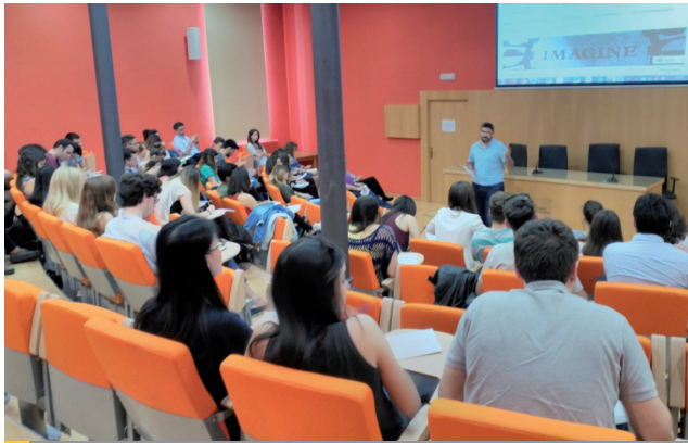
Imagen durante la charla sobre optativas de cuarto curso de ADE

Por otro lado, y como novedad, este curso académico se envió un cuestionario a todos los estudiantes graduados en los cursos 2014-15 y 2015-16 con el fin de conocer: su formación académica posterior al grado, cómo y dónde había sido su incorporación al mercado laboral, así como los motivos por lo que consideraban que habían sido contratados. Con esta encuesta se pretende implantar un método de trabajo para poder hacer un seguimiento de los egresados de ADE de Zaragoza, al tiempo que se daba cumplimiento al Informe realizado por ACPUA con fecha 22 de marzo de 2016, en el que aconsejaba implantar algún método (encuestas o grupos de discusión) adicional a los ya existentes que permitiera recabar la opinión de los egresados. La tasa de respuesta a esta encuesta, como viene siendo habitual cuando se realizan las encuestas de satisfacción con la titulación, asignaturas o actividad docente, fue muy baja.