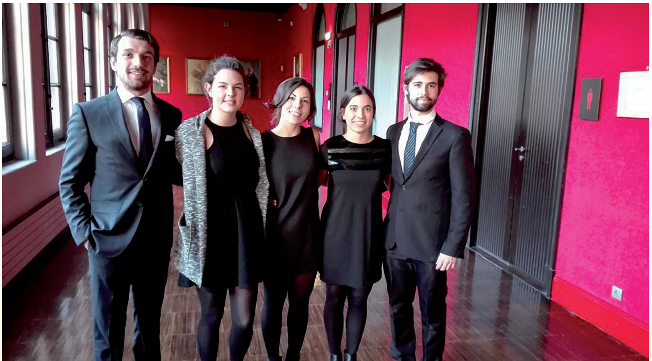
Componentes del equipo Duckies.

Desde el equipo decanal queremos hacerles llegar con estas líneas nuestra más sincera enhorabuena.