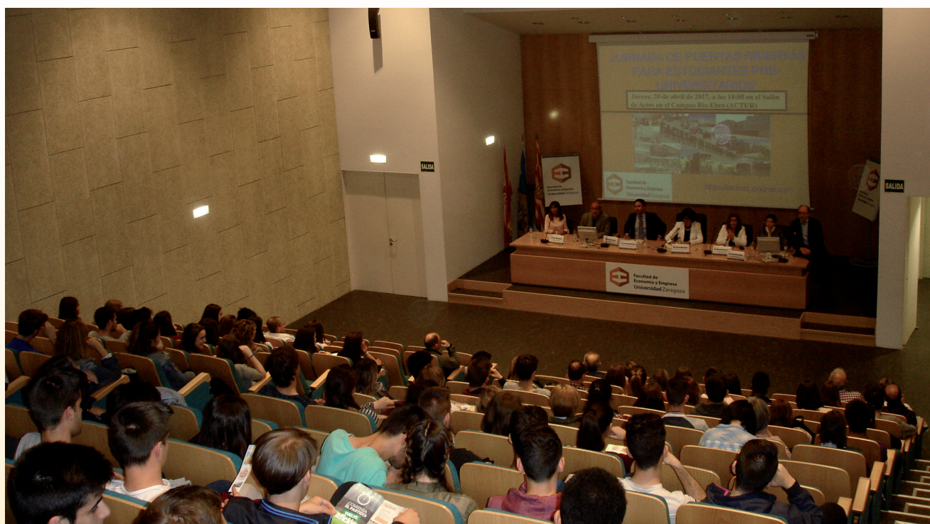
Jornada de Puertas Abiertas

Asimismo, el 5 de abril de 2017 se realizó una Jornada Informativa de Postgrados en la que se presentaron los diferentes Estudios Propios y Másteres que se ofertan en nuestra Facultad.