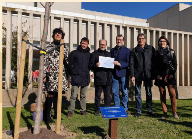
Miembros del equipo decanal con un Castaño de Indias

La plantación está formada por 21 árboles singulares, con los que se ha querido representar a cada Facultad o Escuela de la Universidad, a la propia Universidad de Zaragoza, así como a los centros adscritos, los Institutos de Investigación y otros centros de la Universidad.