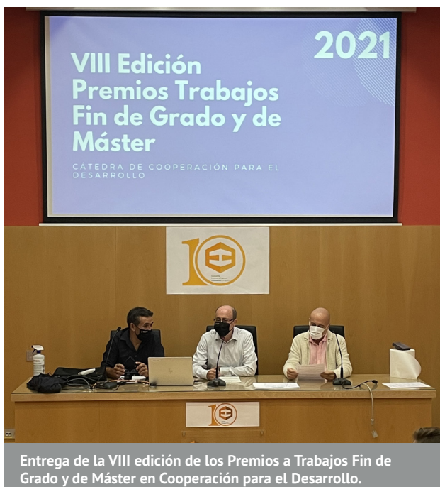
Entrega de la VIII edición de los Premios a Trabajos Fin de Grado y de Máster en Cooperación para el Desarrollo.