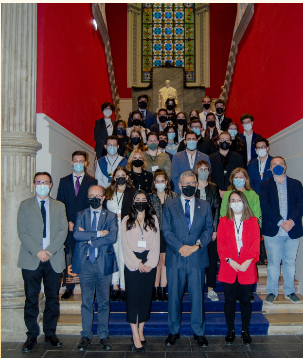
Inauguración del VI Encuentro de ANEEOE

Finalmente queremos invitaros a seguirnos en redes sociales. Nos podéis escribir para cualquier cosa, estamos abiertos a nuevas ideas e iniciativas.