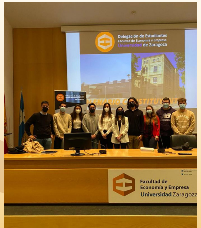
Nueva Directiva de la Delegación de Estudiantes