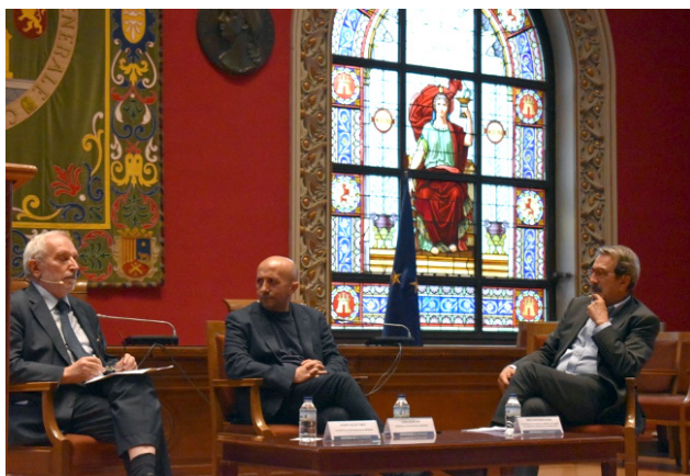
Imagen tomada durante las Jornadas