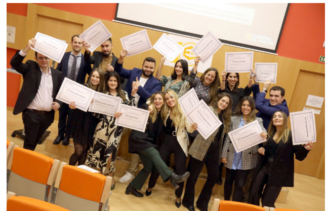
Estudiantes de la 24 edición, curso 2020-21