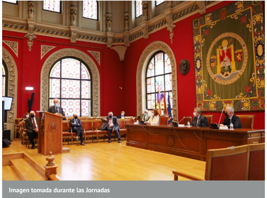
Imagen tomada durante las Jornadas

Economics, Journal of Economics and Management Strategy, Journal of Labor Economics, Journal of Accounting and Economics, Journal of Money Credit and Banking, Journal of Financial Stability, entre otras muchas publicaciones. Además, hasta el momento ha dirigido veinticinco tesis doctorales.