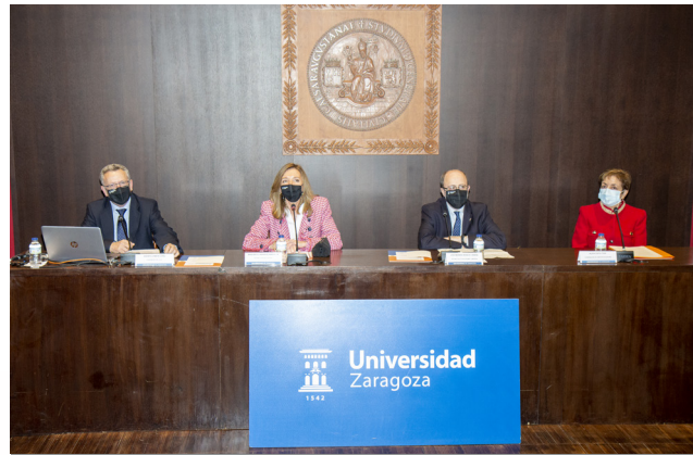
Imágenes tomadas durante la Clausura del Máster en Auditoría