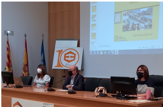
Imagen tomada durante una de las Jornadas de Bienvenida a estudiantes de nuevo ingreso.