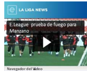
Navegador del Video

www.europapress.es es el portal de actualidad y noticias de la Agencia Europa Press. © 2011 Europa Press. Está expresamente prohibida la redistribución y la redifusión de todo o parte de los contenidos de esta web sin su previo y expreso consentimiento.