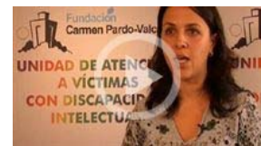
Presentan el proyecto "No + abuso"