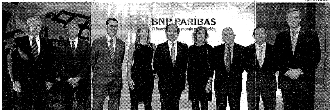
►► Los responsables del equipo de la firma, ayer, en el 'photocall' que recibió a los invitados.