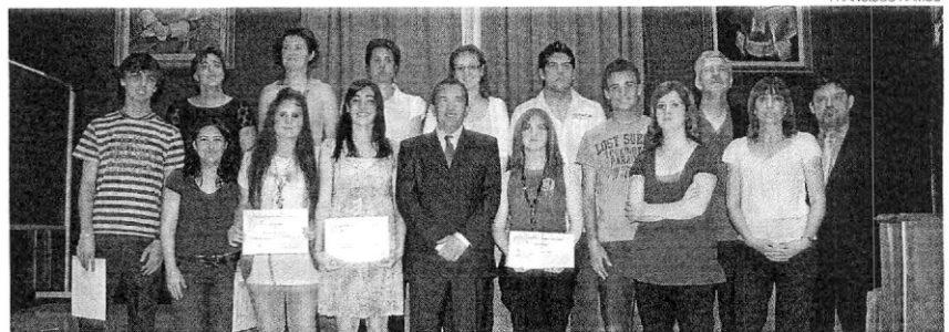
► Los ganadores, juntos, tras la entrega de premios.