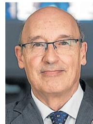
F. Gutiérrez-Solana. G. MESTRE

«Lo más importante es que el emprendimiento rural en Aragón