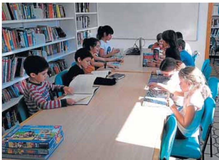
Los niños del colegio son usuarios habituales de la biblioteca de Laspuña, pero sobre todo muchos adultos.

Además, se ha convertido en un espacio en el que los vecinos dan clases de inglés y de francés con un profesor jubilado.