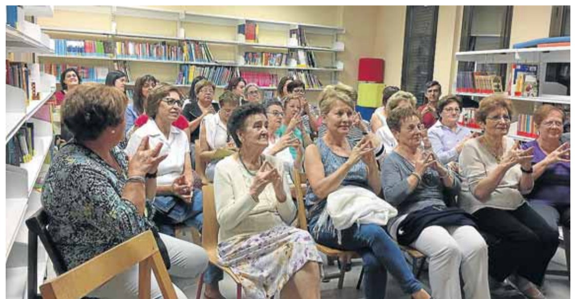
Usuaris de la biblioteca de Lanaja en un cuentacuentos para adultos con el que cierran el curso.

Hasta ahora, en el club de lectura eran todo mujeres de entre 40 y más de 70 años y este año, por primera vez, se ha apuntado un hombre. Esta actividad fun-