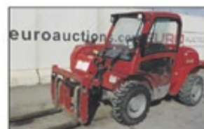
2008 JCB 520-40