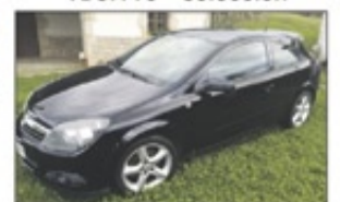
2006 Opel Astra GTC