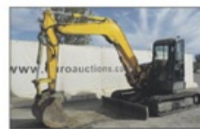
2005 Yanmar VI075-A

¡Subasta 100% libres de reservas de equipos para la Construcción, Agricultura, Coches y Equipamiento de Garaje, TODO vendido al mejor postor!