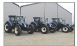
No Usado New Holland TD5.110 - selección