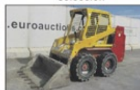
2005 Bobcat S130