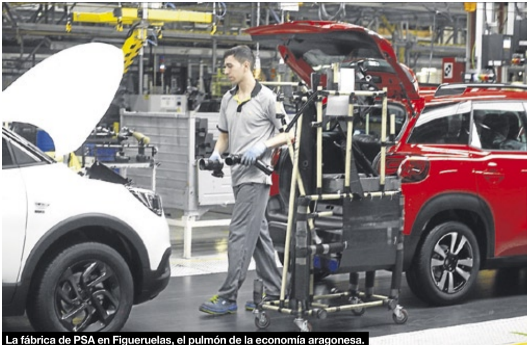
La fábrica de PSA en Figueruelas, el pulmón de la economía aragonesa.