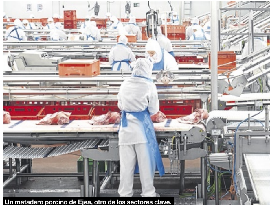
Un matadero porcino de Ejea, otro de los sectores clave.