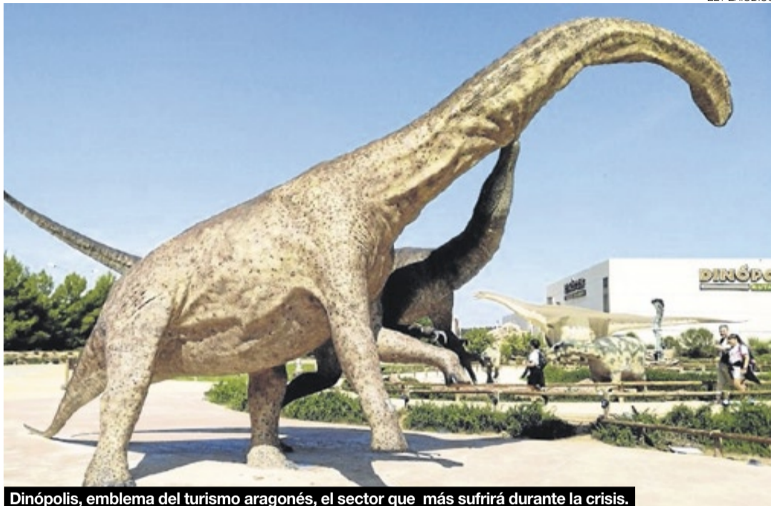
Dinópolis, emblema del turismo aragonés, el sector que más sufrirá durante la crisis.

permanentes en el empleo y la supervivencia empresarial».