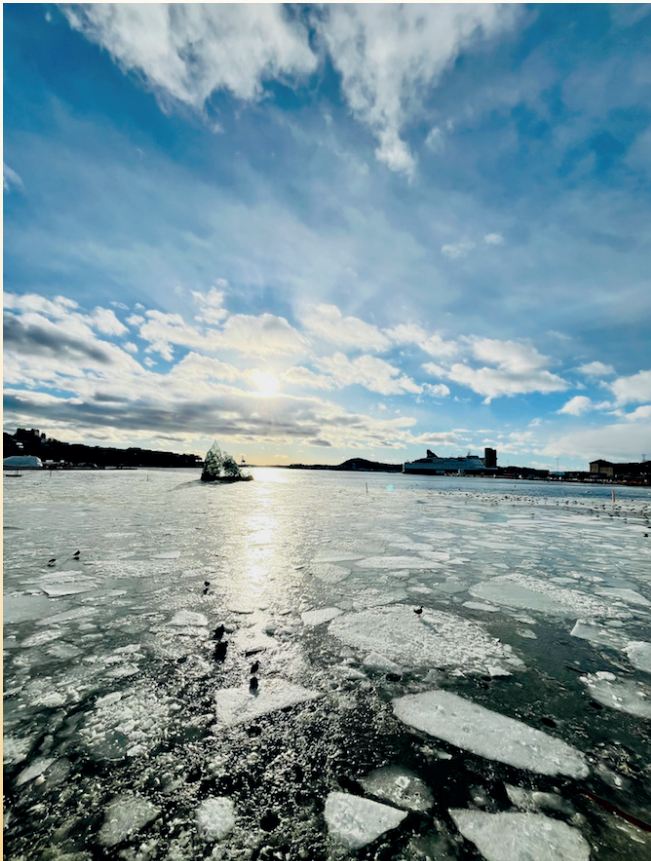
“Resplandor Helado”. Fotografía ganadora del concurso de Fotografía “Trotamundos” de la Facultad de Economía y Empresa en su edición de 2024.