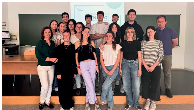
Estudiantes de 3º MIM participantes en la investigación sobre las máquinas de vending de la Universidad.