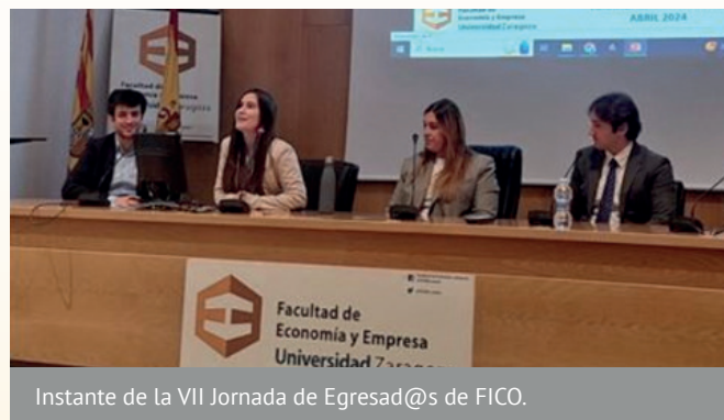
Instante de la VII Jornada de Egresad@s de FICO.