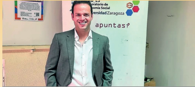
Víctor Meseguer Sánchez. Comisionado Especial para la Economía Social. Ministerio de Trabajo y Economía Social. Gobierno de España (También ha participado en la asignatura optativa de Dirección de Entidades de Economía Social (4º de ADE)).

sufre una auténtica masacre que es objeto de investigación por parte de la justicia internacional; la economía social y el cooperativismo nos recuerdan que otro futuro es posible: con más empoderamiento, más desarrollo sostenible y repartido de forma equitativa, más igualdad, más democracia, y más instrumentos para el desarrollo, la autonomía y la libertad de los pueblos. Las luchas de nuestro tiempo, requieren de una sociedad civil y de una economía social fuertes y libres.