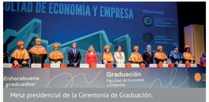
Mesa presidencial de la Ceremonia de Graduación.