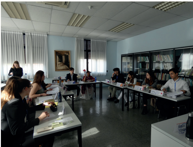
Debate estudiantil MINIMUN 2024. Estudiantes participantes. Colegio Mayor Pedro Cerbuna.

Finalmente, nuestros colaboradores y colaboradoras escribieron 9 artículos para el suplemento de cooperación de El Periódico de Aragón titulado “Espacio3” donde hablaron de los temas más actuales en esta materia.