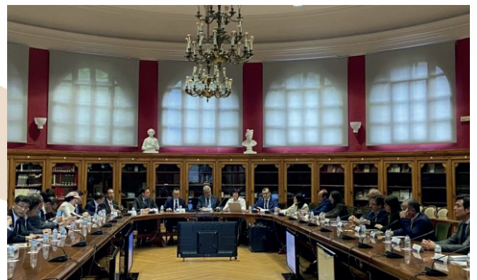
Imagen tomada durante el encuentro empresarial celebrado.

El encuentro no solo sirvió para estrechar lazos entre los empresarios de ambas regiones, sino que también destacó el importante papel de la Cátedra Zeumat en la vinculación de empresas del sector aragonés con el comercio internacional. Los asistentes coincidieron en señalar el gran impacto de esta iniciativa y la necesidad de continuar promoviendo este tipo de encuentros que facilitan la colaboración y el desarrollo de proyectos conjuntos.