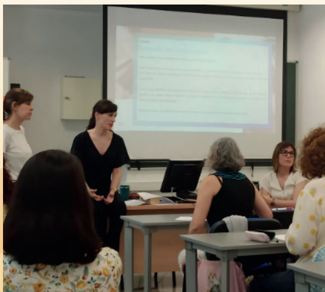
Foto tomada en el Taller sobre “Competencia de Trabajo en Equipo”, impartido el 30 de mayo de 2024.