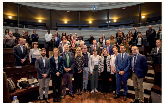
Imagen tomada durante la constitución de ARACOOOP - Federación de Cooperativas de Trabajo, Consumo y Uniones de Cooperativas de Aragón.

Aragón es cuna de muchas fórmulas comunitarias y cuenta como referentes con la cooperativa de consumo «La Igualdad Zaragozana» en 1871, y con la cooperativa «Casa Ganaderos», reconocida como la primera empresa en España. La actividad de ARACOOOP bebe de estas referencias y valores para dar prioridad a las necesidades y aspiraciones de sus miembros por delante del capital y la maximización del beneficio económico, a través de la autoayuda y del empoderamiento, la reinversión en el entorno y el compromiso con el bienestar de las personas y comunidades, con responsabilidad medioambiental. El cooperativismo aragonés reivindica el papel esencial de la economía social y solidaria, tal y como declara la Asamblea de las Naciones Unidas en su Resolución A/77/L.60, de 18 de abril de 2023, sobre la Promoción de la economía social y solidaria (ESS) para el desarrollo sostenible. Asimismo, pone en valor su arraigo local, que ofrece oportunidades a las zonas rurales, y su mayor resistencia a las crisis, generando empleo de calidad y empleo más inclusivo.