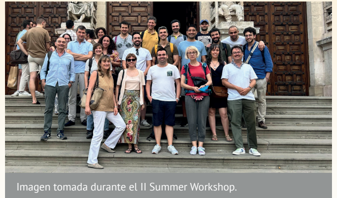
Imagen tomada durante el II Summer Workshop.