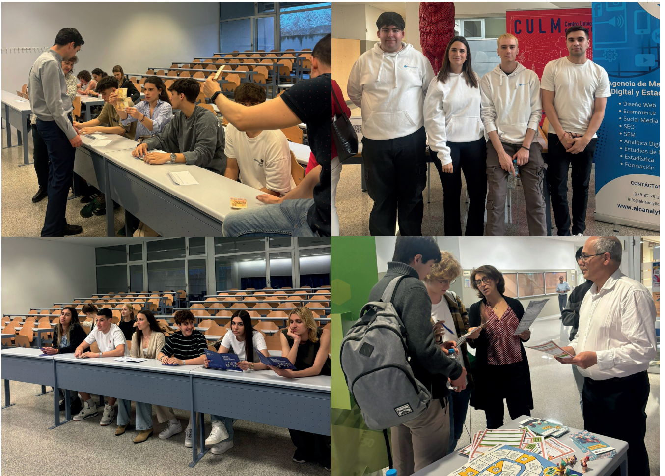
Imágenes tomadas durante los Talleres realizados.