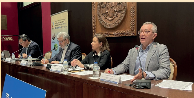
Mesa inaugural III Congreso IEDIS.