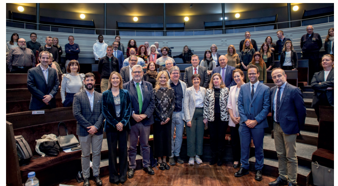
Acto de presentación de Aracoop. Paraninfo de la Universidad.

La Facultad de Economía y Empresa ha jugado un papel crucial en su creación, brindando apoyo académico y recursos esenciales. Esta colaboración no solo fortalece a las cooperativas, sino que también enriquece la formación y la investigación que se realiza en nuestra Facultad, dando visibilidad a un modelo organizativo de referencia en nuestra Comunidad Autónoma.