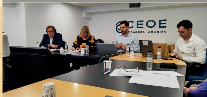
Jornada "Colaboración Público-Privada: Demandas de la Empresa Aragonesa". Sector Automoción".