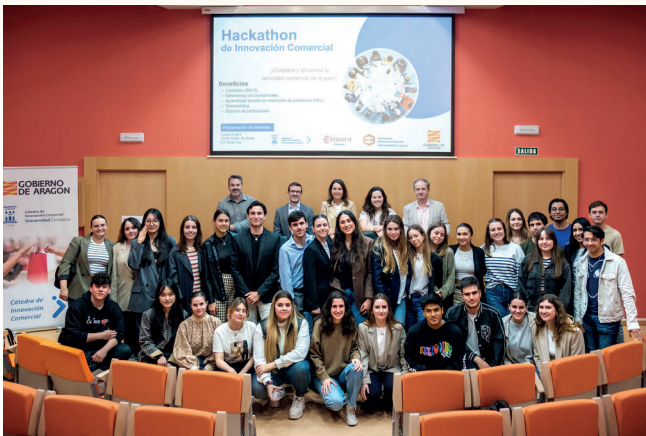
Imagen tomada durante el Hackathon de Innovación Comercial.

Para vincular a los estudiantes y el tejido empresarial, la Cátedra ha organizado varias iniciativas destacadas. Entre ellas cabría destacar el Hackathon de Innovación Comercial , organizado en colaboración con Cámara Zaragoza. Este evento dinámico y creativo está diseñado para revitalizar el comercio en las zonas comerciales de Aragón, ofreciendo a los estudiantes universitarios un entorno de aprendizaje activo y colaborativo. Los participantes tienen la oportunidad de desarrollar propuestas innovadoras para zonas comerciales específicas, que pueden incluir planes de comunicación, implementación de nuevas tecnologías, o creación de nuevos modelos de negocio. El Hackathon no solo proporciona una plataforma para que los estudiantes apliquen sus conocimientos en un contexto real, sino que también contribuye significativamente al sector comercial de Aragón, introduciendo innovaciones que pueden ser adoptadas por los comerciantes locales.