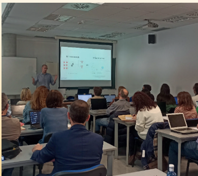
Foto tomada en una de las sesiones del Taller sobre “Inteligencia Artificial aplicada a la docencia y la investigación”, llevado a cabo en el Campus Paraíso el 13 de marzo de 2024.

Por último, el pasado 30 de mayo, en el Campus Paraíso, se impartió un taller sobre la Competencia de Trabajo en Equipo, dirigido al personal docente e investigador de nuestro centro. El taller, de carácter eminentemente práctico, se centró en la evaluación de esta competencia dentro y fuera del aula. El interés de este taller radica en que la capacidad de trabajar en equipo es fundamental para que nuestros egresados se desenvuelvan eficazmente durante su vida profesional. Además, esta competencia transversal está incluida en el Sello 1+5 UNIZAR y deberá ser evaluada en al menos dos asignaturas de las nuevas titulaciones de grado que funcionarán como punto de control. Este taller contó con la asistencia de 20 profesores e investigadores.