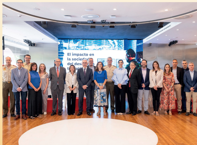
En la imagen, foto de la Jornada “El impacto en la sociedad del desarrollo tecnológico en defensa”.