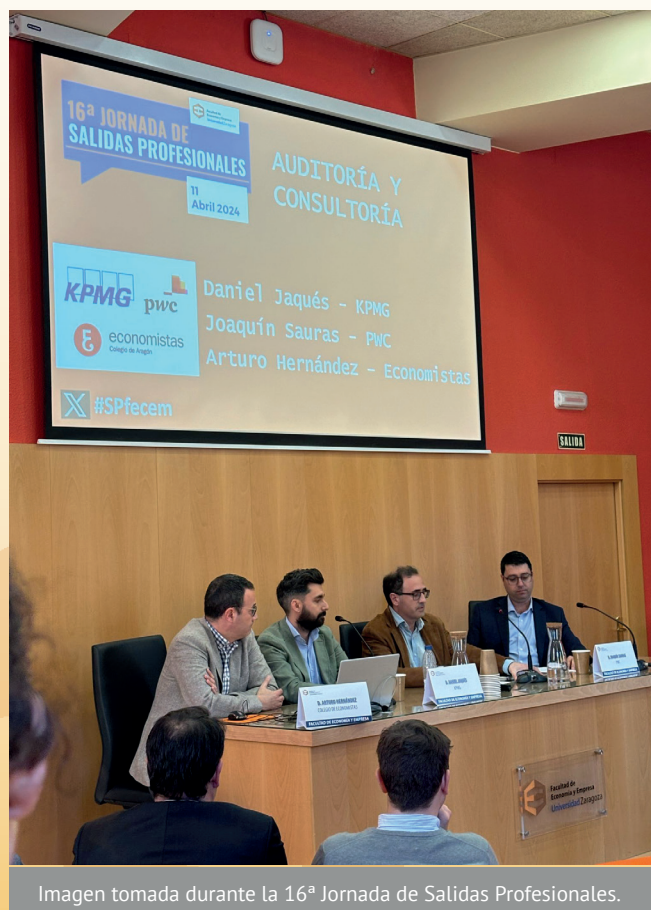
Imagen tomada durante la 16ª Jornada de Salidas Profesionales.

de prácticas en empresa, dirigidas a formar perfiles profesionales asociados a nuestras titulaciones.