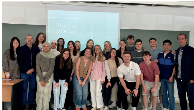
Estudiantes de 3º MIM participantes en la investigación sobre la participación del estudiantado en la Universidad.

Por otra parte, se ha querido atender las demandas de los estudiantes y se han organizado diversas charlas y seminarios de orientación. Así, se solicitó al Adjunto a la Decana para Relaciones con la Empresa y Emprendimiento que organizase una charla para explicar el funcionamiento de las prácticas en empresa a los estudiantes de tercero.