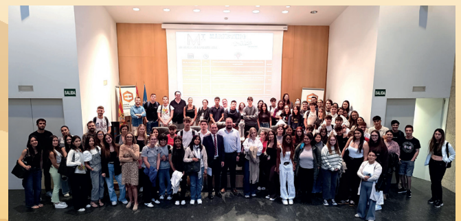
Foto de familia en la sesión inaugural de Marketing Talks.