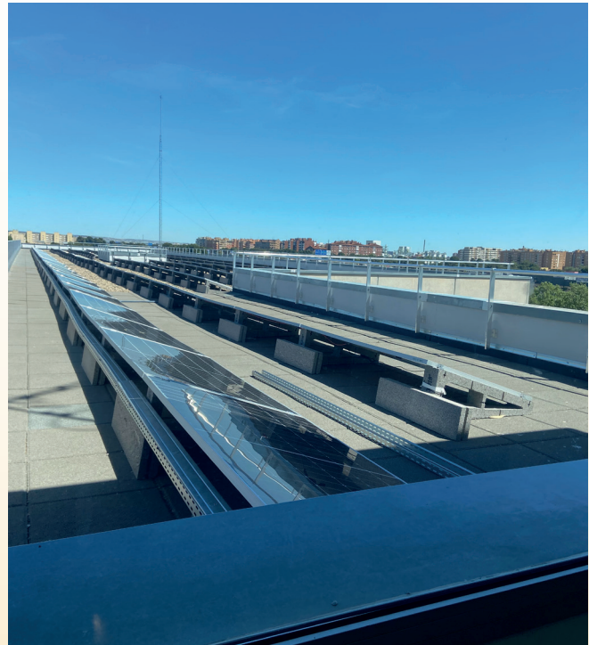
Imagen de las placas solares instaladas.