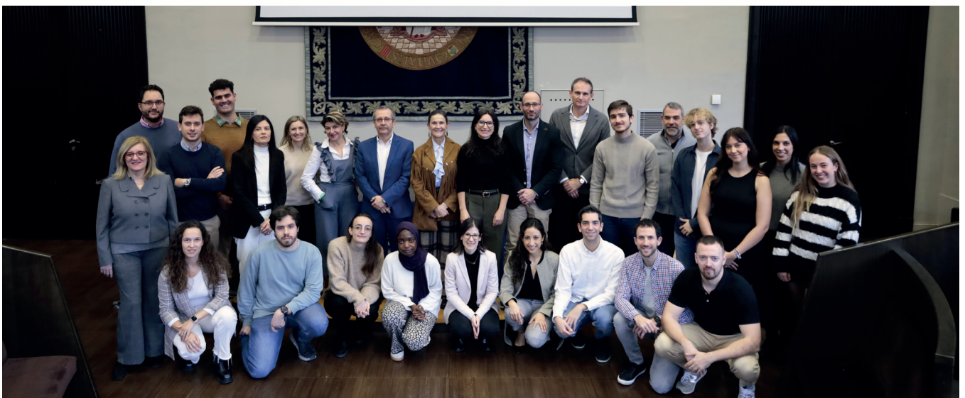
Imagen tomada durante la ceremonia de entrega de premios de II Spin-Transfer (Fase 1).