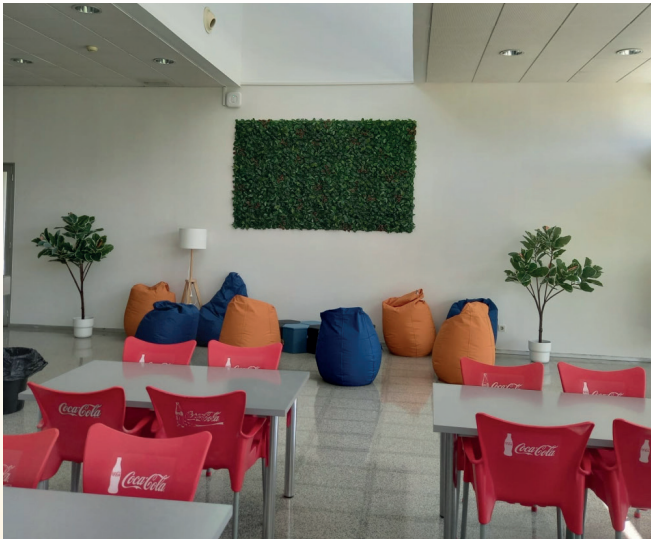
Imagen del Espacio de Convivencia en el edificio Lorenzo Normante.