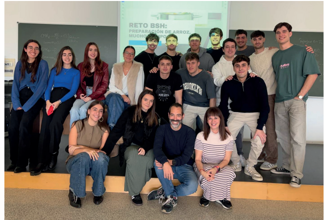
Estudiantes de 3º del Grado en MIM participantes en el Reto BSH.

el cocinado mediante procesos de cocción. Y en Marketing Público y No Lucrativo se ha colaborado con Unizar Saludable, diseñando acciones para dar a conocer el servicio BiciUnizar y para concienciar a la comunidad universitaria sobre la importancia de tener unos hábitos de alimentación saludable.