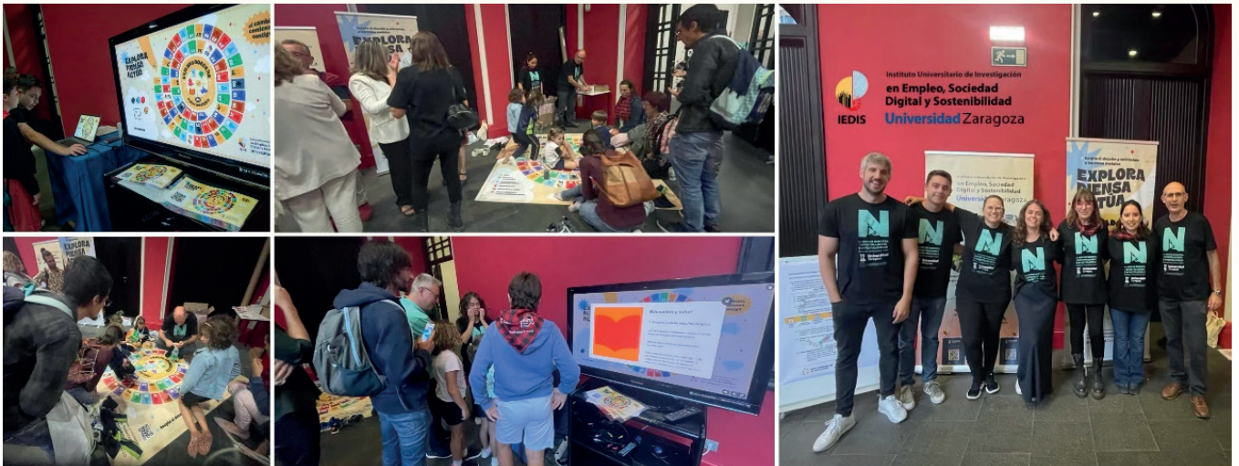
Imágenes tomadas durante la Noche Europea de los Investigadores e Investigadoras.

de la Universidad de Zaragoza, quien subrayó que “este laboratorio refleja el compromiso de la Universidad con la investigación interdisciplinar y su impacto en los grandes retos sociales”.