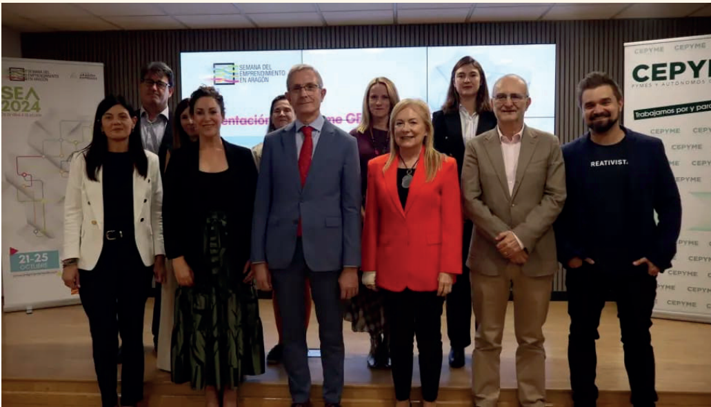
Presentación del Informe GEM 2023-2024 durante la Semana del Emprendimiento de Aragón.

Con estas presentaciones, la Cátedra Emprender se posiciona para liderar diversas iniciativas que impulsen el emprendimiento en Aragón, enfocándose en la innovación, la sostenibilidad y la digitalización, así como en la promoción del talento emprendedor. La nueva dirección tiene la intención de construir sobre estos cimientos, creando un entorno más dinámico y colaborativo que apoye a los emprendedores actuales y futuros, promoviendo así el desarrollo económico y social de la región.