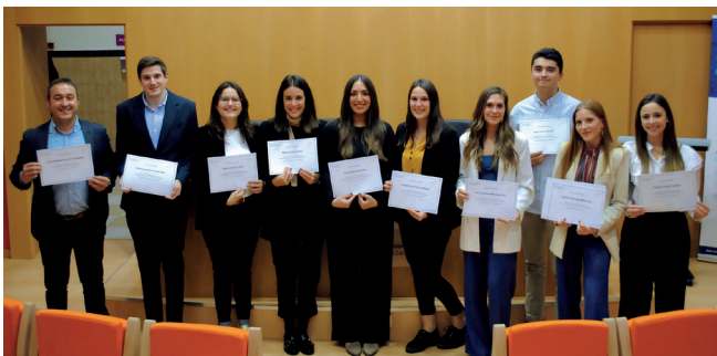
Estudiantes de MAGICEX con el título obtenido.

Los egresados recogieron el título otorgado por MAGICEX al superar el Máster, el título que otorga que han superado el examen que homologa el curso básico de Comercio Exterior de la Cámara de Comercio de Zaragoza, y la orla.