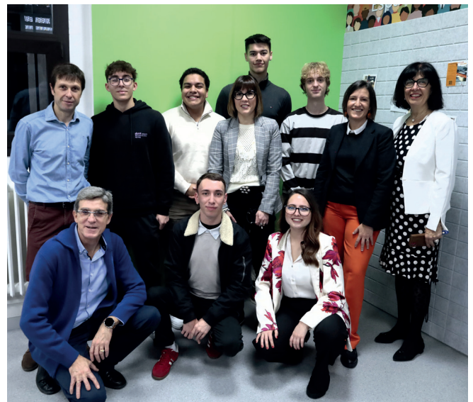
En la imagen, miembros del equipo decanal junto con varios estudiantes de la Facultad.