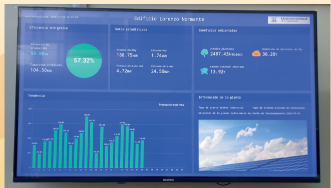
Pantalla informativa de las placas solares instaladas.