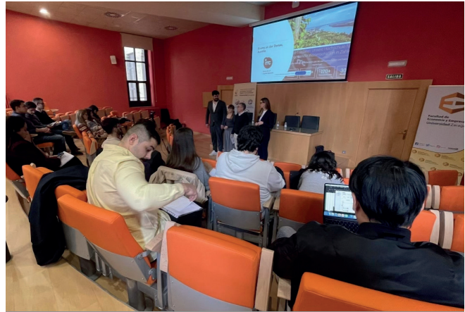
Imagen tomada durante los seminarios internacionales.

IEDIS ha reforzado su labor de divulgación científica mediante actividades que conectan a la ciudadanía con la investigación. A través de talleres, seminarios y publicaciones, el Instituto fomenta el interés por la ciencia y la tecnología, especialmente entre los jóvenes. Además, trabaja en estrecha colaboración con la UCC+I de la Universidad de Zaragoza para garantizar que sus investigaciones tengan un impacto tangible en la comunidad.