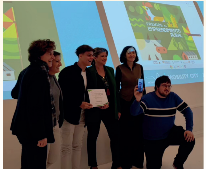
Imagen tomada durante la entrega del Premio al Emprendimiento Rural.