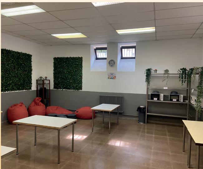
Imagen del Espacio de Convivencia en el semisótano del edificio de Gran Vía.