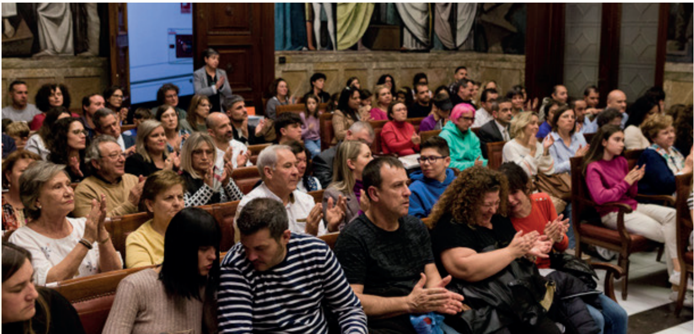
Imagen tomada durante la entrega de premios de la sexta edición del concurso de relato y vídeos.