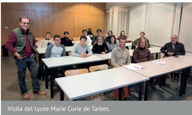
Visita del Lycée Marie Curie de Tarbes.

El dar a conocer nuestro grado también se está haciendo en el ámbito transfronterizo. El día 10 de diciembre contamos con la visita de estudiantes del Lycée Marie Curie de la ciudad de Tarbes, en Francia, que están cursando el Diploma de Contabilidad y Gestión y que otorga una formación superior a un grado de formación profesional, pero no es un grado universitario, que permite a los estudiantes adquirir los conocimientos básicos en los ámbitos de la contabilidad y las finanzas empresariales. Aprovechando una visita cultural que hicieron a Zaragoza, y a pesar del temporal de nieve que sufrieron para cruzar la frontera en su viaje, querían conocer nuestros estudios.