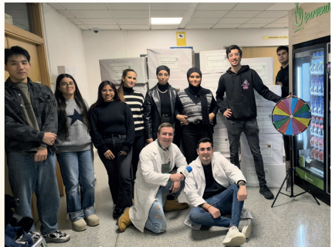
Estudiantes participantes en la actividad de Marketing Público y No Lucrativo con Unizar Saludable.

Por último, durante este semestre se ha elaborado el proyecto formativo de la titulación adaptada al RD 822/2021. Ha sido un arduo trabajo conjunto entre el Equipo de Dirección de la Facultad, los departamentos y el profesorado, y constituye el punto de partida para el diseño de las nuevas asignaturas. Continuaremos trabajando en los contenidos, la coordinación entre asignaturas, las metodologías docentes empleadas y el fortalecimiento de las soft skills de nuestro alumnado, con el objetivo de seguir formando a profesionales de marketing preparados para enfrentarse con éxito a los retos del mercado laboral.