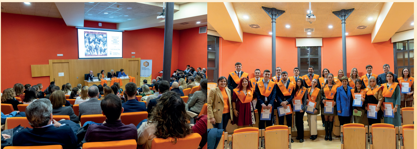
Imágenes tomadas durante la clausura de la X Promoción del Máster Universitario en Auditoría.

Un ejemplo de esta colaboración es el recientemente firmado acuerdo entre la Fundación Ibercaja Banco, Plancontrol Auditores y Consultores y la Cátedra de Auditoría de la Universidad de Zaragoza para la creación de los premios MANUEL INDARTE , orientados básicamente en 3 líneas: