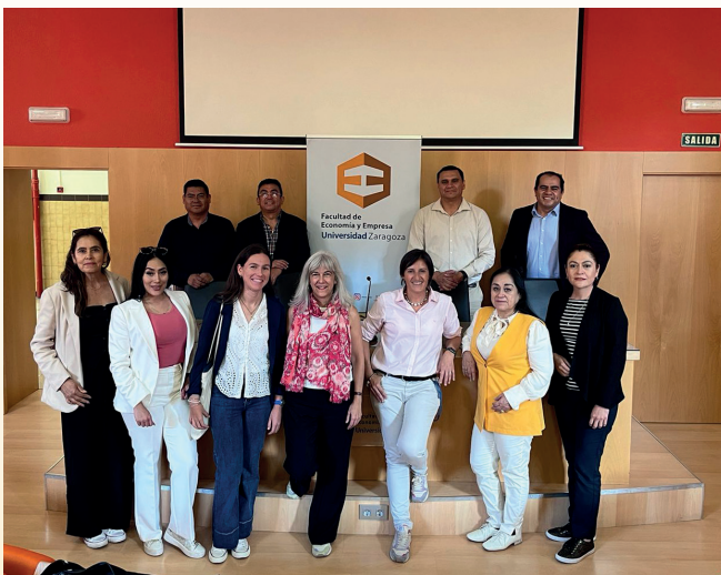
Visita de la delegación de gerentes de cooperativas mexicanas a la Facultad.

En septiembre, el LAB_ES recibió nuevamente a la delegación de gerentes de cooperativas mexicanas, organizada junto con la Universidad de Jalisco. Este encuentro permitió estrechar lazos entre el cooperativismo español y mexicano, promoviendo el intercambio de experiencias y conocimientos.