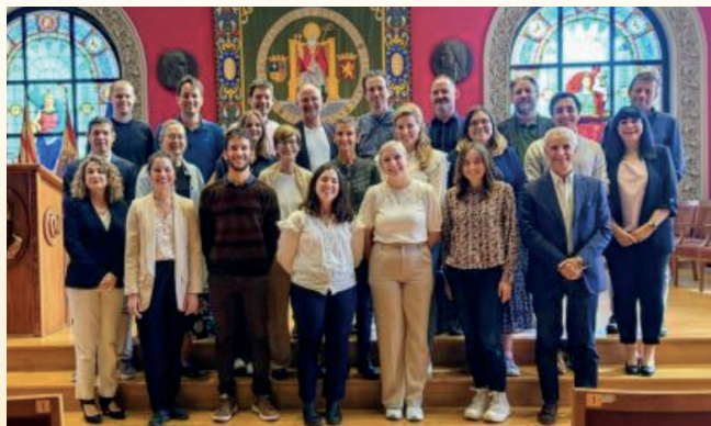
Imagen tomada durante la reunión anual del Proyecto ROBUST.