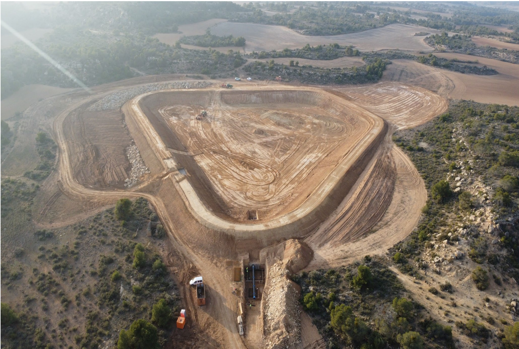
PEBEA VALSA VALDELASFUESAS