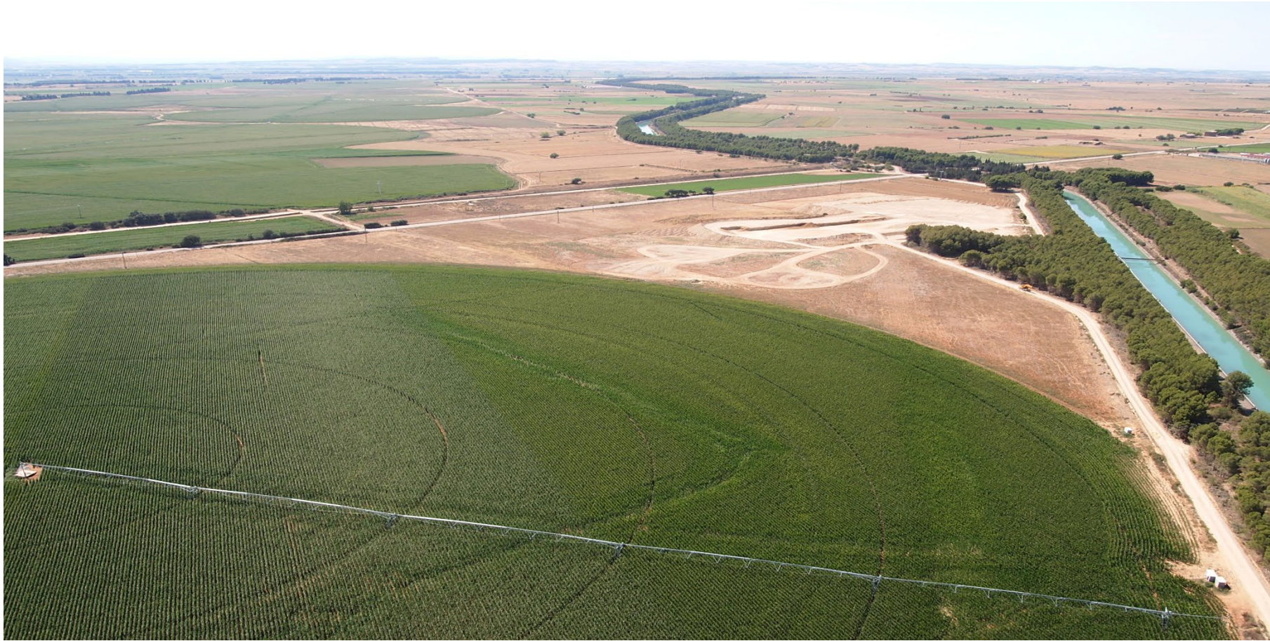
SIFÓN DE CARDIEL