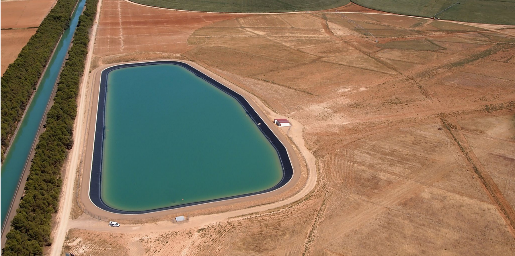
SIFÓN DE CARDIEL

MODERNIZAR NO ES CONSUMIR MÁS AGUA ES USAR MEJOR LA QUE TENEMOS