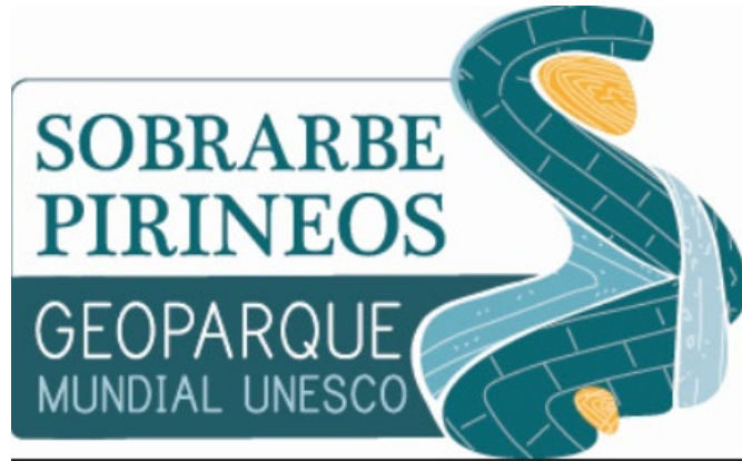
Geoparque Mundial UNESCO