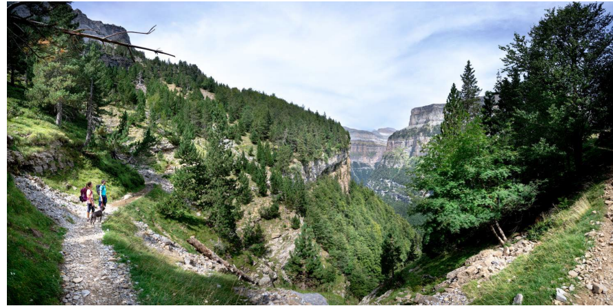
Parque Nacional de Ordesa y Monte Perdido